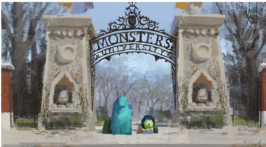
堤·大介，情景繪圖：開除出校，《怪獸大學》，2013 年，數碼繪圖 © Disney/Pixar

是次展覽介紹各種以傳統媒介創作的精選作品，包括素描草圖、彩繪、分鏡圖及雕塑等，這些既是彼思藝術家歷年創作的成果，也是每部動畫電影製作過程中不可或缺的一部分，當中每一形狀、顏色和線條，都是表達角色喜怒哀樂，以至開展故事情節的重要元素。此外，展覽亦透過創作人的訪問片段，讓觀眾窺探原創故事的靈感來源。《彼思動畫 30 年：家+友·加油！》將為觀眾提供一個難得的機會，走進彼思動畫那些風靡全球而又感動人心的作品，了解其背後的創作過程和所運用的藝術技巧。