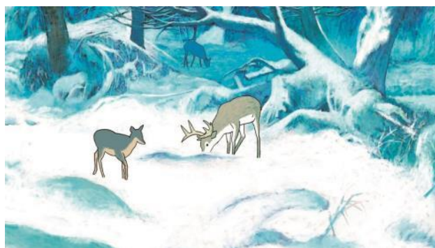
《本性》 峯制作 2014 年

「港式動人動畫」展覽將介紹最近十年香港動畫界的發展和動向，透過展出本地著名及新進動畫創作者的作品，以及口述歷史訪問，展現香港動畫工業的活力和無限創意，讓觀眾認識本地動畫人才，欣賞他們的創作，從而感受本地文化中不可忽視的一面。