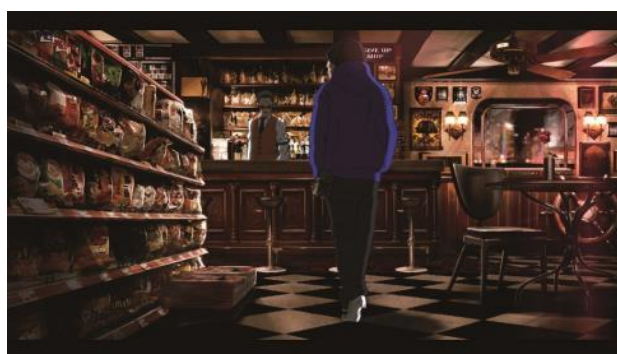
Taste the Life Zcratch Creation 2011 年