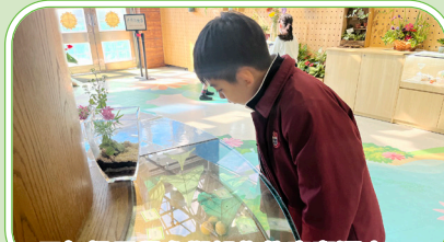
三年級同學參觀綠化教育資源中心，讓他們知道有關綠化香港的活動，了解和體驗綠化和環保的重要。