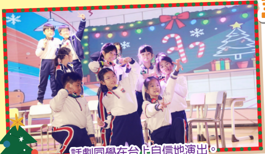
話劇同學在台上自信地演出。