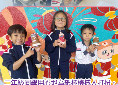
二年級同學用心地為紙杯機械人打扮，你看他們的機械人多漂亮。