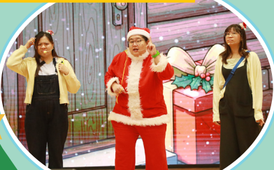
充滿聖誕氣氛的話劇，既有趣又有意義！