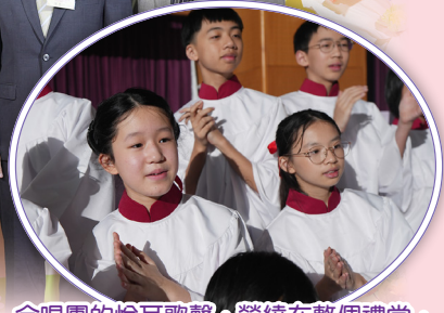
合唱團的悅耳歌聲，縈繞在整個禮堂，為晚會增添了無比動人的色彩。