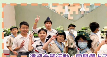
透過參觀活動，同學們上了一堂生動的國防教育和國民教育課