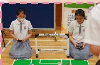
同學們都十分投入不同的科技活動

學生以微型機械裝置進行球類接力，體會作用力與反作用力及摩擦力影響；以氣壓系統發射模型火箭，學習壓縮空氣推進、拋物線軌跡與最佳發射角；運用彈射機構瞄準發射，理解彈性儲能與釋放；在門球挑戰中觀察動能與位能轉換；以投壺感受拋體運動與重心穩定；用微型發射器完成投擲，掌握槓桿支點、力臂與力矩；並操作遙控足球車，練習轉向控制與策略協作。學生反應