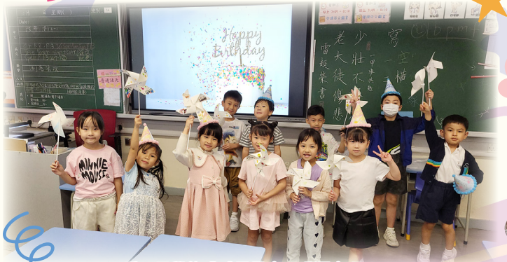
看!同學的「感恩風車」多漂亮啊!