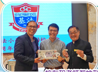
校友和老師都抽到大獎，皆大歡喜！

一年一度的校友會聚餐在2025年10月31日在富滿樓海鮮酒家順利舉行，大家說說笑和影影相，過了一個快樂的晚上呢！