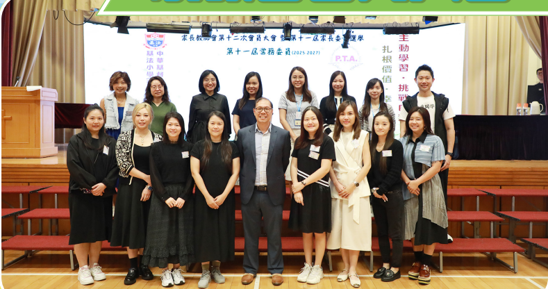
恭喜新一屆家教會家長委員順利當選，謹致祝賀！願家校同心，薪火相傳。