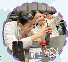
同學親自製作火箭模型

於航天展區內，「登陸月球」與「探測火星」專題展提供由淺入深的圖文與實物展示，從探測器設計到任務規劃皆有清楚介紹，讓學生對深空探測的科學原理與工程挑戰有更全面的理解。本次交流活動內容豐富，既拓展了學生的科學視野，也啟發了創新思維。