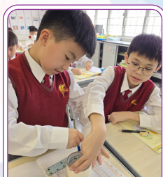
在課堂中動手嘗試

透過以上的策略，學校期望為學生創造一個更積極、具幸福感的學習環境，促進他們的主動學習與幸福成長，讓每一位學生都能在這個充滿挑戰與機遇的時代中茁壯成長。