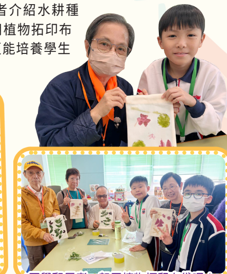
同學和長者一起用植物拓印布袋呢!