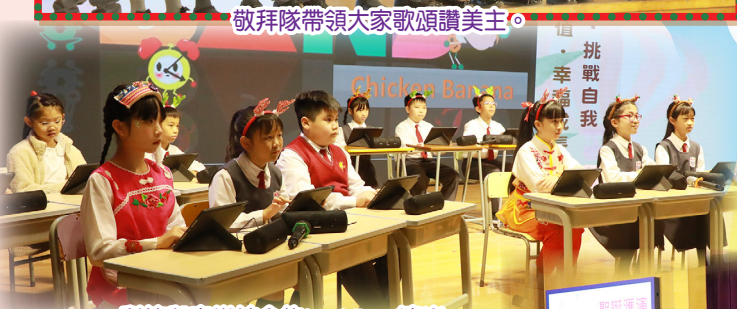
科技與音樂結合的Ipad Band演出。