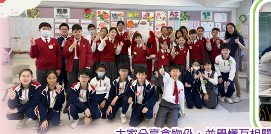
大家分享食物外，並學懂互相關愛及珍惜快樂的時光。