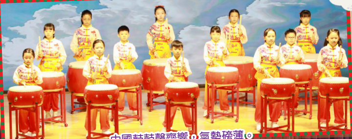
中國鼓鼓聲齊響，氣勢磅礴。