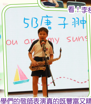
同學們的敬師表演真的既豐富又精彩!