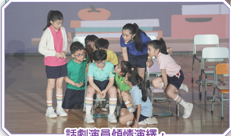
話劇演員傾情演繹，為大家帶來一齣富有意義的福音話劇。

在「六十周年校慶晚會」熱鬧的禮堂中，歌唱、舞蹈、話劇等表演精彩紛呈，共同交織出一場凝聚歡笑與感動的晚會。