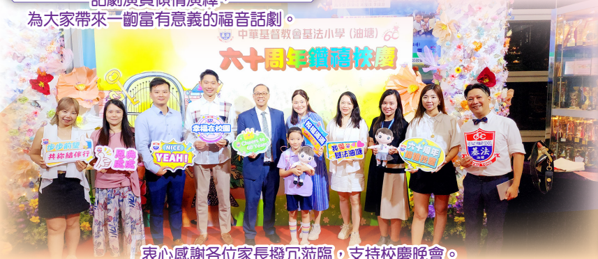
衷心感謝各位家長撥冗蒞臨，支持校慶晚會。