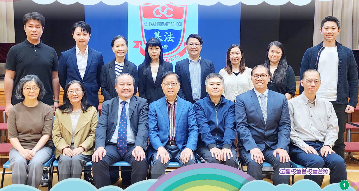
法團校董會校董合照

「我們愛，因為神先愛我們。」（約翰一書4:19）它提醒我們，為人父母無需獨自背負所有重擔。當感到心力交瘁時，敞開心扉，向伴侶、親友、學校或專業人士尋求支持，恰是愛與智慧的體現。讓我們繼續攜手，心意相連，彼此扶持，共同以溫柔而堅定的愛，為孩子們築起一個安全、溫暖、充滿希望的未來。