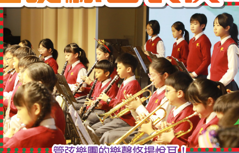
管弦樂團的樂聲悠揚悅耳！