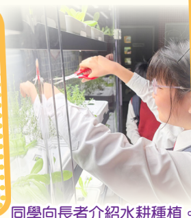
同學向長者介紹水耕種植。