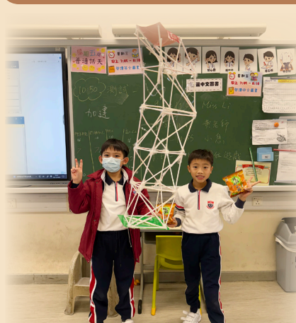
三年級同學是建築師，他們互相合作，利用飲管、卡紙及膠紙製造了不同的摩天大廈。