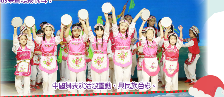
中國舞表演活潑靈動，具民族色彩。