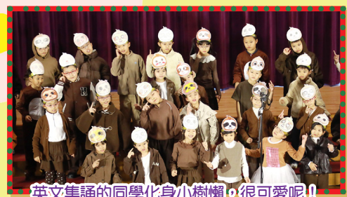
英文集誦的同學化身小樹懶，很可愛呢！