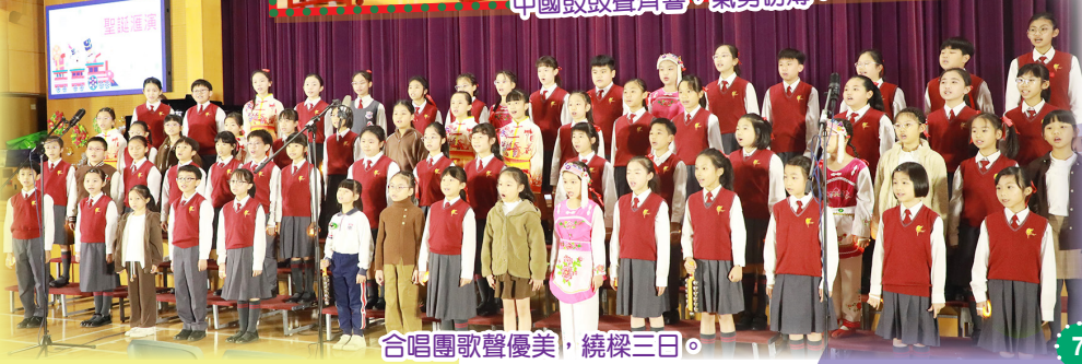
合唱團歌聲優美，繞樑三日。