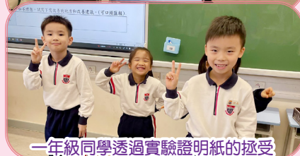
一年級同學透過實驗證明紙的承受力有多強，他們竟可站立在紙上。