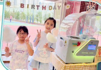
各位生日同學都滿載而歸!