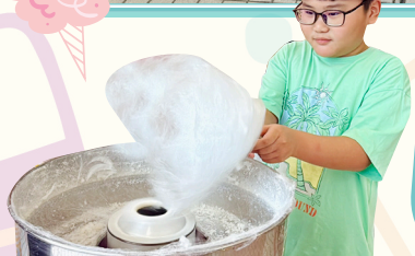
同學們能一嘗自製「棉花糖」，真開心!