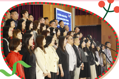
教師大合唱以歌聲為大家送上聖誕祝福。