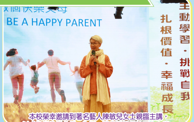
本校榮幸邀請到著名藝人陳敏兒女士親臨主講，以「做個快樂父母」為題。講座圍繞保持正向心態、建立和諧親子關係等議題展開，內容豐富實用，令在座家長深感共鳴，滿載而歸。