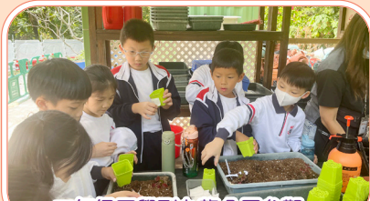
二年級同學到九龍公園參觀，他們不但認識樹木名稱，還學習種植，可見他們多麼投入啊！