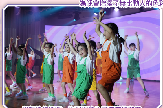
一段輕快的舞蹈，為現場注入了滿滿的歡樂。