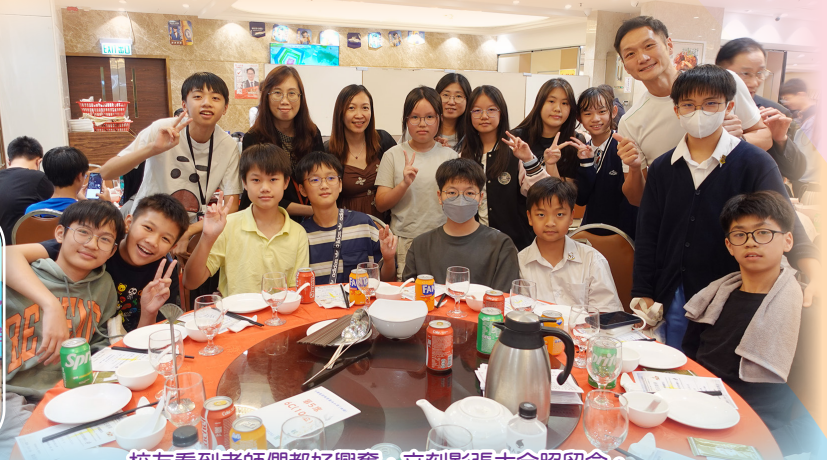
校友看到老師們都好興奮，立刻影張大合照留念。