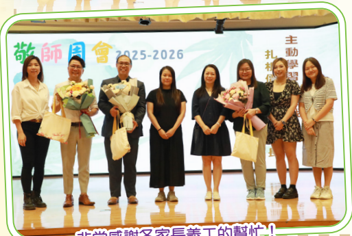
非常感謝各家長義工的幫忙!