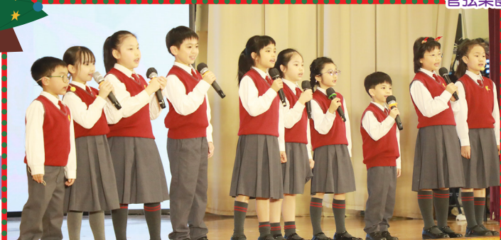
敬拜隊帶領大家歌頌讚美主。