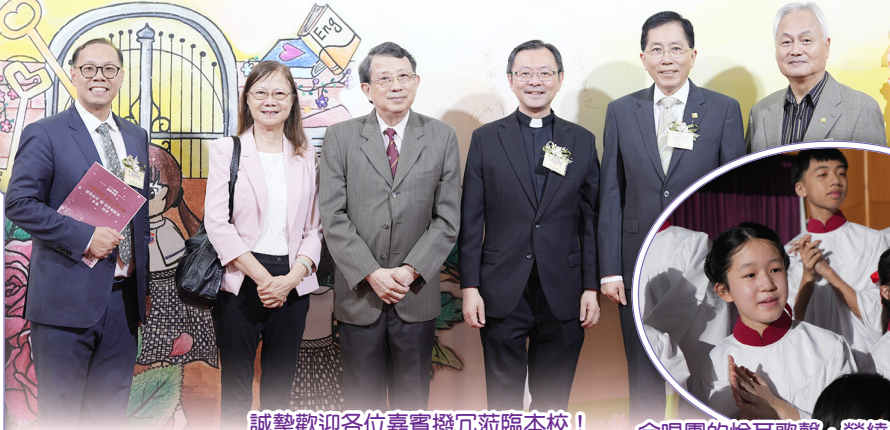
誠摯歡迎各位嘉賓撥冗蒞臨本校！