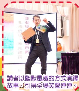
講者以幽默風趣的方式演繹故事，引得全場笑聲連連。

學生在四月份的復活節崇拜中歌頌讚美神，聆聽聖經故事，認識主耶穌的愛與復活的恩典。