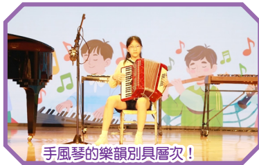
手風琴的樂韻別具層次！