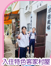
入住特色客家村屋