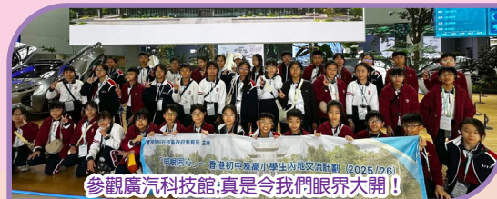
參觀廣汽科技館，真是令我們眼界大開!