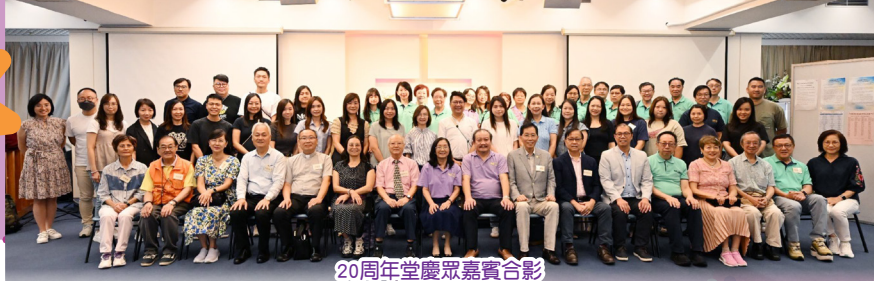
20周年堂慶眾嘉賓合影

情緒是學生人生成長的重要課題。能夠積極面對、妥善處理情緒的學生，學業通常表現更穩定，人際關係更和諧，面對挫折也更有韌性。聖經中許多人物經歷過強烈的情緒波瀾，其中大衛的故事，為我們提供了極佳的情緒管理教材。