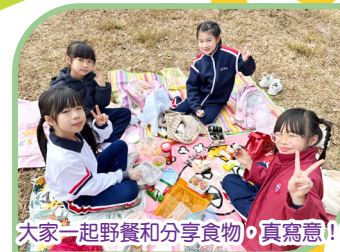
大家一起野餐和分享食物，真寫意！