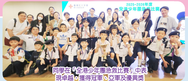
同學在「全港少年團急救比賽」中表現卓越，獲得冠軍、亞軍及優異獎