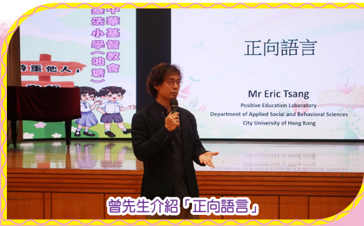
曾先生介紹「正向語言」