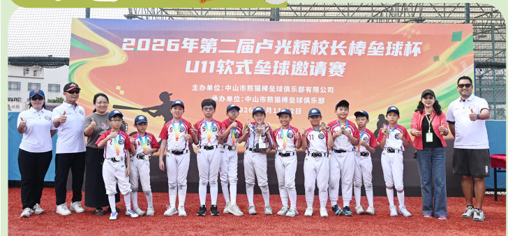
本校那亞方舟棒壘球校隊，獲邀前往中山熊貓紀念球場，參加「2026年第三屆盧光輝校長棒壘球杯U11軟式壘球邀請賽」，榮獲亞軍。