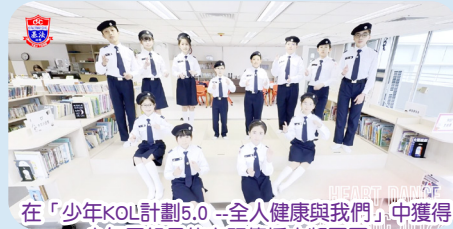
在「少年KOL計劃5.0 - 全人健康與我們」中獲得少年團組最佳主題傳播大獎冠軍。