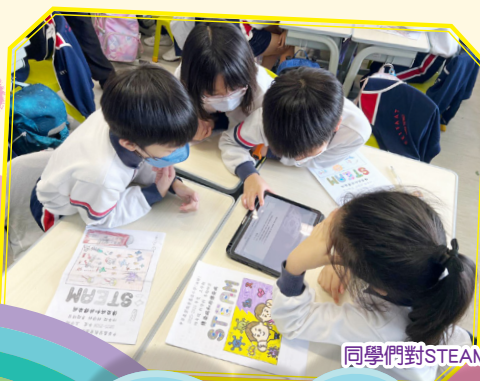
同學們對STEAM活動都很感興趣，你看他們多投入！