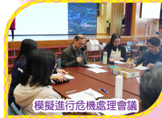
模擬進行危機處理會議