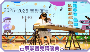
古箏琴聲宛轉優美。