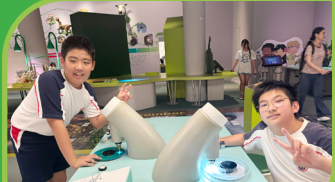
同學在「生命科學廳」運用顯微鏡探索微生物世界

他們面對各項先進的互動展品，如「磁電廊及力學廳」、「人工智能」、「生命科學廳」等，表現得既興奮又好奇，積極投入各項科學探究活動。