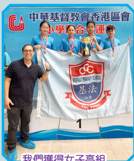
我們獲得女子高組團體冠軍！