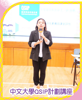
中文大學QSIP計劃講座