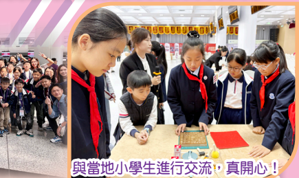
與當地小學生進行交流，真開心!