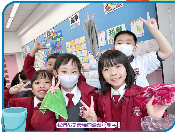
我們都是最棒的清潔小能手!