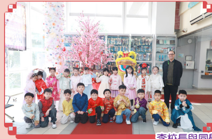
李校長與同學們笑得多燦爛啊!