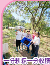
一分耕耘一分收穫

「相聚慶春約 · 喜迎冬至節」—荔枝窩客家生活體驗 同學參與了由教育局舉辦的國民教育考察活動，透過入住荔枝窩傳統客家村屋及生活體驗，包括農務、觀星、茶粿製作、參觀、探訪等，不但深刻認識了荔枝窩村的歷史及文化，更體驗了團結及堅毅的人文精神，還打開了古代建築與自然美學的藝術視野呢！