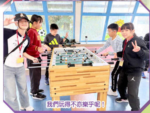
我們玩得不亦樂乎呢!