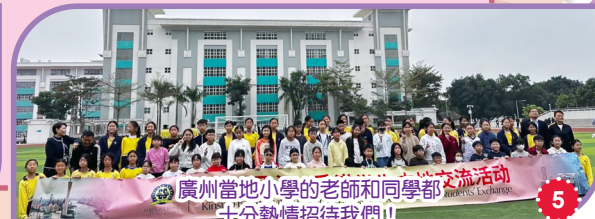
廣州當地小學的老師和同學都十分熱情招待我們!