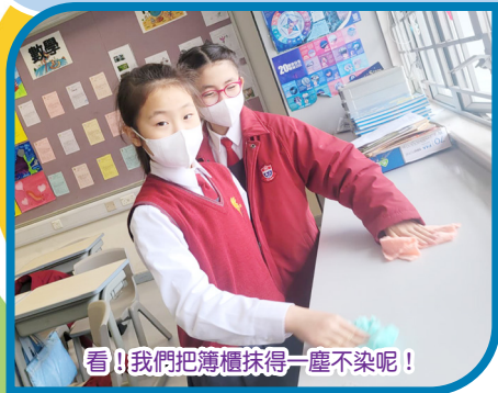
看!我們把簿櫃抹得一塵不染呢!