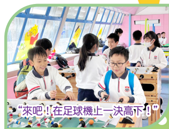
“來吧！！在足球機上一決高下！”