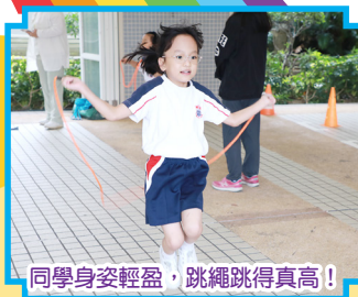
同學身姿輕盈，跳繩跳得真高！