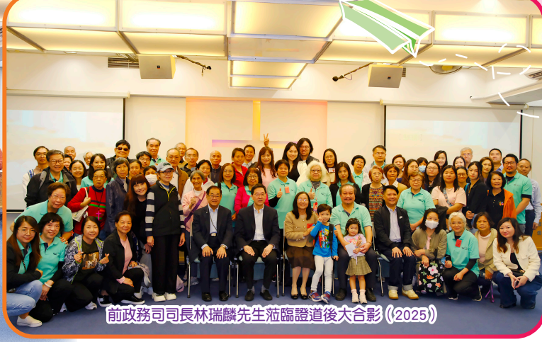
前政務司司長林瑞麟先生蒞臨證道後大合影 (2025)