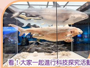
看!大家一起進行科技探究活動。