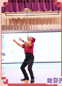
雜耍表演非常精彩!