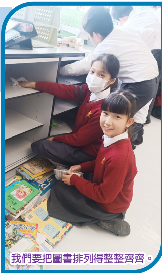
我們要把圖書排列得整整齐齊。