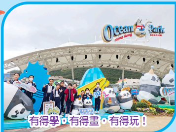
有得學 · 有得畫 · 有得玩！