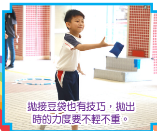
拋接豆袋也有技巧，拋出時的力度要不輕不重。