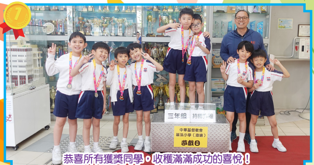
恭喜所有獲獎同學，收穫滿滿成功的喜悅！