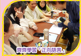
齊齊學習「正向語言」