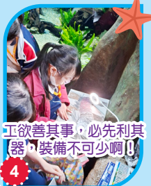
工欲善其事，必先利其器，裝備不可少啊！！