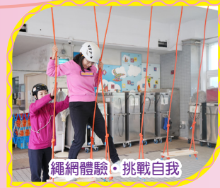
繩網體驗·挑戰自我