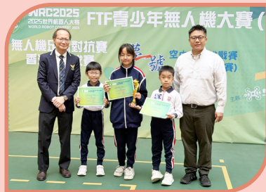
同學參加「FTF青少年無人機大賽(全國賽) 香港區選拔賽」，榮獲佳績。