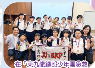
在「東九龍總部少年團急救比賽」中獲得冠軍及季軍。