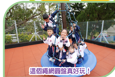
這個繩網圓盤真好玩！