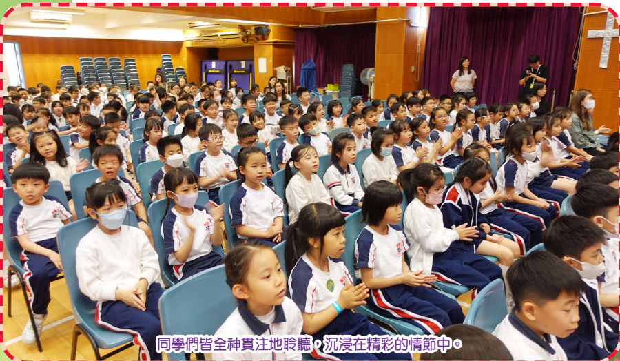
同學們皆全神貫注地聆聽，沉浸在精彩的情節中。