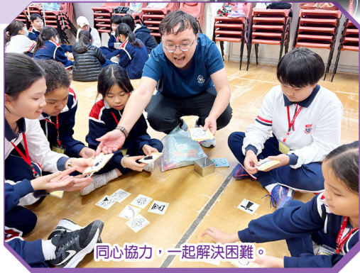
同心協力，一起解決困難。