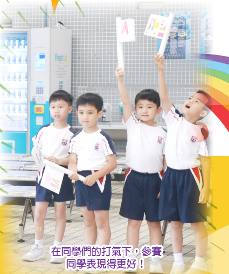
在同學們的打氣下，參賽同學表現得更好！

雖然遊戲日當天因下雨而留校進行，但無阻同學發揮合作和堅持的體育精神，盡情享受運動競賽的樂趣。