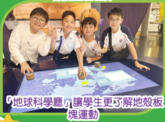
「地球科學廳」讓學生更了解地殼板塊運動