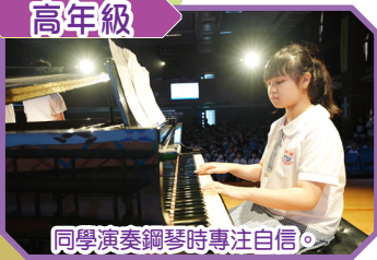
同學演奏鋼琴時專注自信。