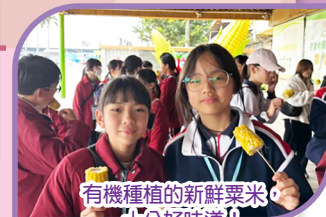
有機種植的新鮮粟米，十分好味道!