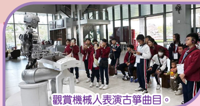
觀賞機械人表演古箏曲目。