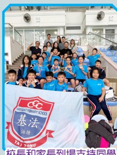
校長和家長到場支持同學