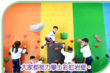
大家都努力攀上彩虹岩壁。

旅行日當天同學們懷着興奮又期待的心情去旅行，一、二年級到鯉魚門公園，三、四年級到西貢戶外康樂中心，五、六年級到曹公潭戶外康樂中心。同學們都盡情享樂，體驗不同的活動，增進了彼此之間的友誼。