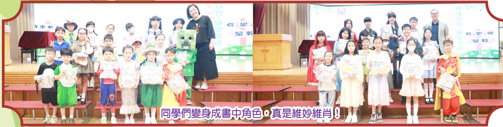
同學們變身成書中角色，真是維妙維肖！

為響應4月23日的世界閱讀日，同學們化身書中的人物走到現實世界，不論是參與禮堂的圖書講座，還是在課室裏分享圖書，大家都相當投入，沉浸在閱讀的氛圍中。