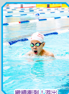
繼續衝刺！游出最好的成績！