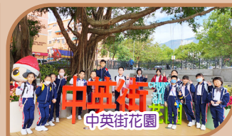
中英街 中英街花園

同學們參觀沙頭角中英街及沙田香港文化博物館，了解祖國與香港相關的歷史、演變以及保育工作。