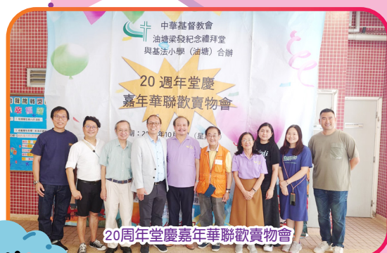
20周年堂慶嘉年華聯歡賣物會