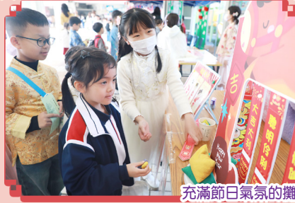
充滿節日氣氛的攤位遊戲真好玩!

今年中國文化日於2月13日順利舉行，當天同學們穿上色彩繽紛的華服，參與各式各樣的攤位遊戲、欣賞雜耍表演、品嚐美味可口的食物及參與義賣活動等。所以，大家都笑容滿面，收穫滿滿！