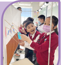
同學們的皮影戲故事描述有板有眼，樂在其中

四年級同學參加了校內皮影戲藝術課程。在導師帶領下，同學們認識了皮影戲的起源與技巧，親手設計並製作屬於自己的小皮影。最後，各組還演出自編故事，利用燈光與音樂展現成果。