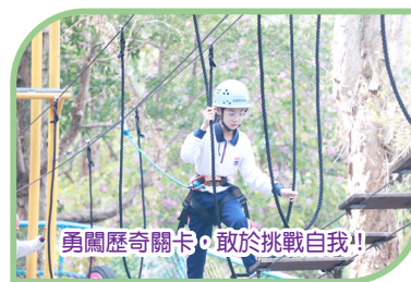
勇闖歷奇關卡，敢於挑戰自我！