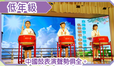
中國鼓表演聲勢俱全。