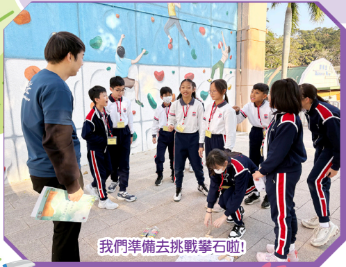
我們準備去挑戰攀石啦!