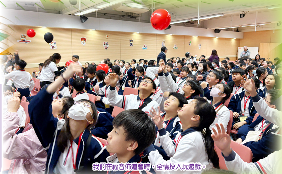
我們在福音佈道會時，全情投入玩遊戲。

這場難忘的小六畢業營充滿歡聲笑語。大家在精彩的集體遊戲中齊心協力，不僅收穫了快樂，更學懂了群體合作。在晚上的福音聚會時間，同學更可聆聽油塘梁發堂的福音分享，從而進一步認識神。