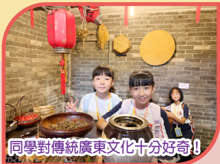
同學對傳統廣東文化十分好奇!