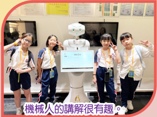
機械人的講解很有趣。