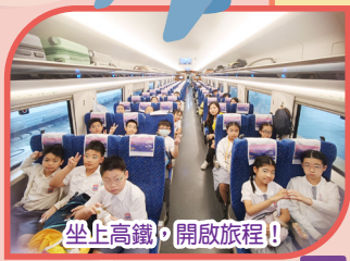
坐上高鐵，開啟旅程!

去年10月31日至11月1日，同學們到廣州進行粵港姊妹學校兩天交流活動。同學們於姊妹學校進行參觀活動及朗誦比賽，藉此全面提升同學的國際視野。