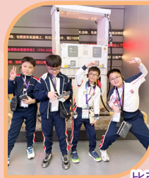
比亞迪空間真有趣!