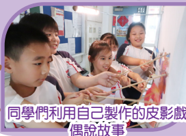
同學們利用自己製作的皮影戲偶說故事

四年級同學參加了校內皮影戲藝術課程。在導師帶領下，同學們認識了皮影戲的起源與技巧，親手設計並製作屬於自己的小皮影。最後，各組還演出自編故事，利用燈光與音樂展現成果。