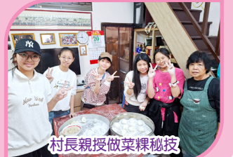
村長親授做菜粿秘技