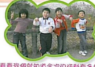
看看我們就知道今天的活動有多好玩！