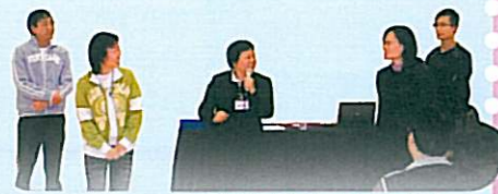
講者樂於解答家長的詢問