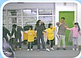
親子合力地踴躍過對方的身體，縱使難度高，也難不到他們。