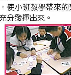
學生正進行合作學習活動