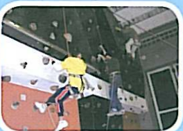
家長及同學困難困難，接受挑戰，一起攀石，從中提升孩子的抗逆力。