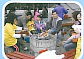
同學與家人一起燒烤，共享天倫之樂，促進親子溝通。