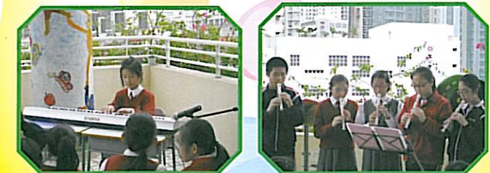
在午間音樂會中，有些同學吹笛，有些同學彈琴，盡顯音樂才華。

音樂會每個學期均舉行兩次，於午間活動時段舉行，學生可自由參與演出，發揮潛能，一嚐演出的滋味。