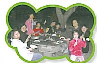
大家邊談邊吃，真是愉快。