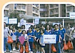
我們準備了不少禮物送給長者，充分發揮社區跨代共融及關愛的氣氛。