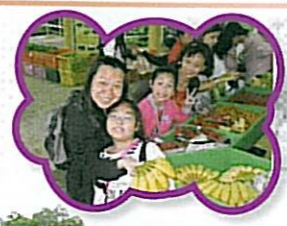
大家聚精會神地在挑選新鮮的有機蔬果。

本校家教會於四月二十六日（星期日）舉辦了海下灣、萬宜西壩風景區親子旅遊。當天早上，大家在校內集合後便浩浩蕩蕩地出發。大隊先到獅子會自然教育中心參觀，然後往海下灣海洋保護區及北潭涌萬宜西壩風景區遊玩。雖然當天不造美，整天下著雨，但大家都樂在其中。