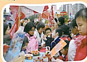
同學積極向市民介紹所售賣的精緻物品，並作出推銷。

四、五年級的部分同學在農曆年期間參加了理工大學的「創新我未來EC計劃」，學習做一個創意企業家，把創意擴展至創造社會價值的層面上，他們在一月份於維園售賣商品，學以致用。