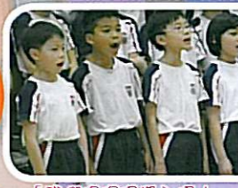
「我們唱得超投入呢！」