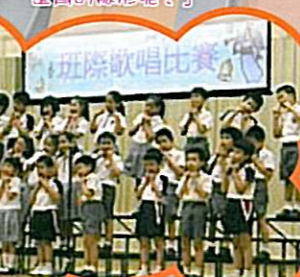
同學們活潑俏皮，唱得真棒！