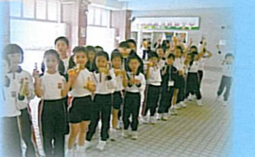
我們終於取得美食了，一起分享吧！