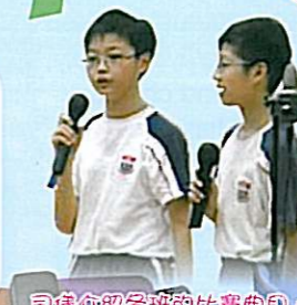
同級介紹各班的比賽曲目。