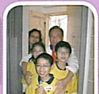
同學積極替長者打掃家居，得乾乾淨淨，又與他們談天，令長者感受到別人對他們的關心。