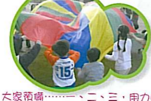
大家預備……一、二、三，用力呀！