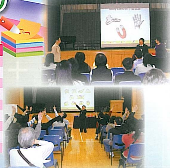
家長們積極聆聽及參與活動