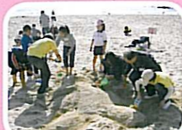
親子同心，其利斷金，大家都在努力地堆沙。