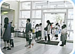
幼稚園的學生在家長陪同下到學校參觀，看見偌大的校舍及各式各樣的展品，表現雀躍。