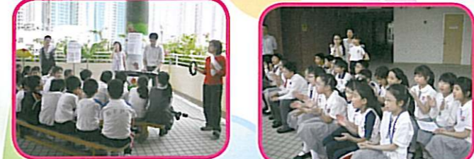
在老師的帶領下，同學們進行午間詩歌敬拜。

每逢星期二，五樓平台都萬人空巷，皆因同學們都熱切期待參與由老師帶領的午間音樂敬拜活動，老師們與同學們透過此小聚一同分享信仰。