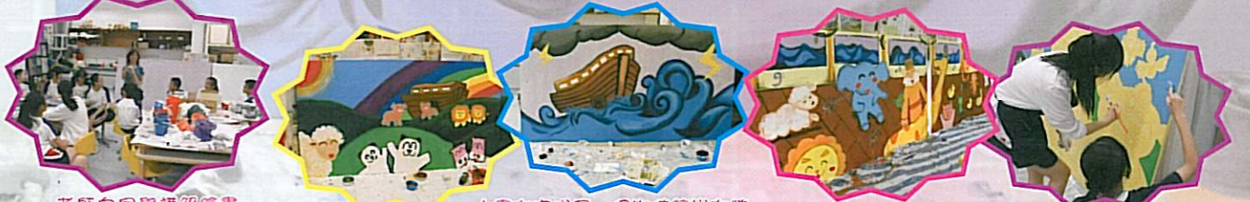
老師向同學講解繪畫的程序及技巧。