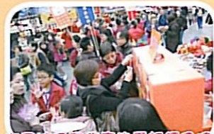
市民被同學售賣的電話機及肥皂所吸引，到攤位中踴躍選購。