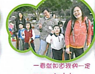
一看就知道我們一定 sure win!!