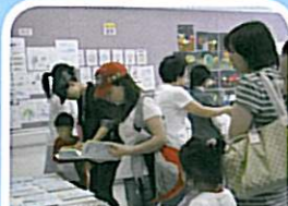
家長和同學細心欣賞同學作品及教室的展品。