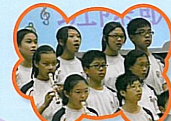
歌聲加上節子的伴奏，帶現出合作的精神。