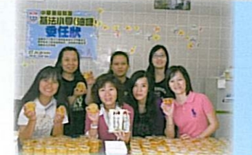
看！熱心的家長義工為我們製作了很多美味可口的食物。