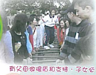
有父母做後盾和支持，子女必定能跨過任何難關