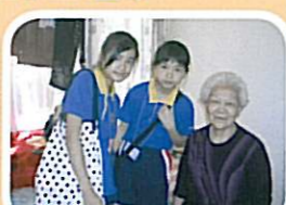
同學和長者談天，了解長者的生活及需要。