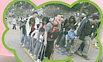
到底最頑皮的星是哪一個呢？