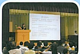
家長及學生都用心聆聽梁校長詳盡地講解學校的特式。