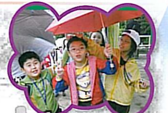
看，我們玩得多開心！