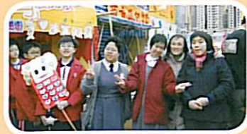
匡智會的師生教導同學製造精美的肥皂，並合力在年宵中售賣。