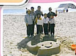
完成了，快來看看他們的作品多趣。