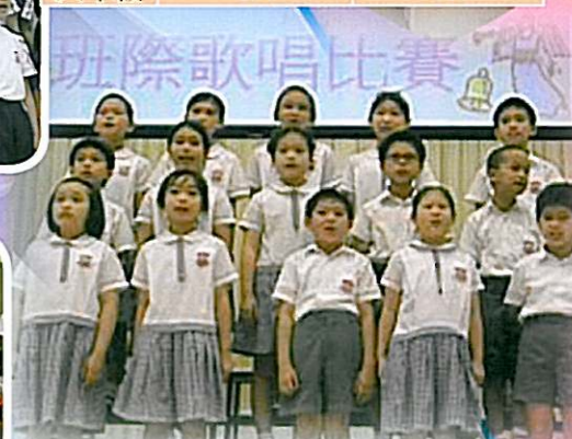
「讓我閃耀！讓我閃耀！」讓我們為你獻唱悅耳的歌聲。