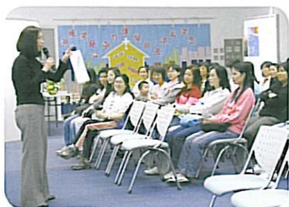
EDD戴女士來校介紹講英語故事技巧