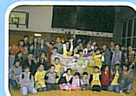
大家成功完成艱巨的任務後，開心地拍大合照。