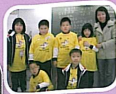
完成活動後，同學們出色的表現獲得全場觀眾的嘉許，頗獲獎賞。