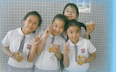
大家都吃得津津有味。