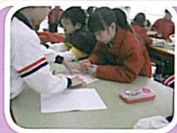
在探訪長者前，同學用心設計心意卡，送給長者留念。