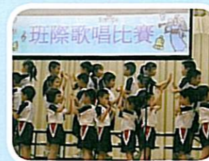
「我們練了很久才有這麼整齊的隊形呢！」