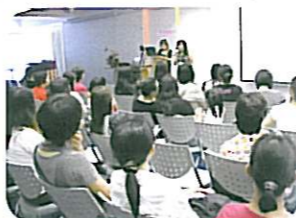
譚老師、尹老師分享指導溫習測考的要訣