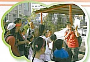
大家都細心聆聽導遊的介紹

家教會在二月七日舉辦了「親子歷奇活動日」，親子一起參觀屏山文物徑後，於黃昏時進行親子歷奇活動及在大棠郊野公園一起燒烤。是次活動既可認識歷史文物，又可藉遊戲增進親子感情，大家共同渡過了一天歡樂的時光。