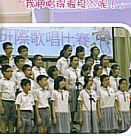
高年級的同學表現自然穩重。