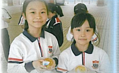
嘩！令人垂涎三尺的啫喱！