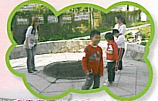
究竟還有什麼東東呢？大家可以从他的表情知道嗎？