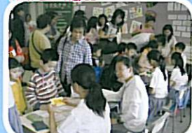
幼稚園的學生參加多元化的科組活動，感受校園的學習生活。