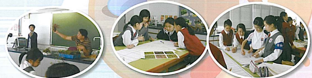
中文大學講者在講解創作意念。

本校參與由房屋署及中文大學合辦「綠化油塘—社區參與計劃」，同學按創作意念分成八組，進行了一連串由中文大學到校園的工作坊，期間同學亦進行了「綠化油塘壁板設計比賽」，每組製作一幅園藝設計圖，優勝組別之作品將製成2米闊×8.5米高，由9款植物組合成的壁板，安裝在區內。