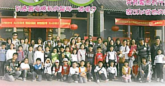
浩浩蕩蕩，向屏山文物徑出發！