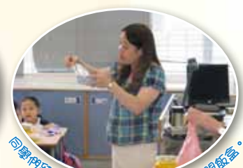
同學們留心聽老師講解和示範怎樣打開飯盒。