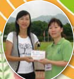
梁校長頒發感謝狀予家長義工，多謝他們的幫助，令運動會順利完成。