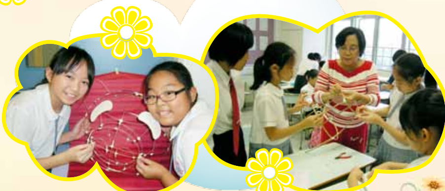
基督少年軍及女少年軍在導師的教導下，合力製作花燈。雖然過程中講求技巧，但他們也順利完成。