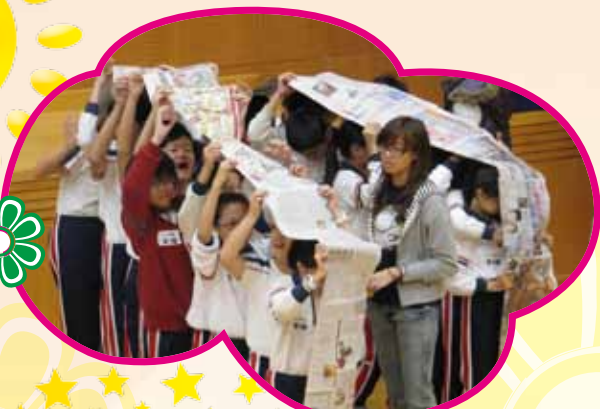
領袖生在十一月接受訓練，從活動中學生學習承擔責任、處理問題的技巧和方法，藉以建立團隊合作精神，啟發學生的領導潛能。