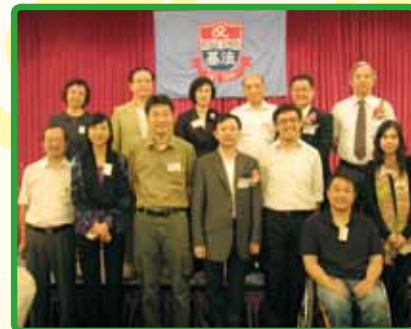
大家難得聚首一堂，所以拍下珍貴的一刻。