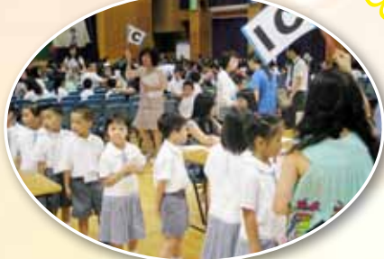
各位小一新生排好隊準備接受多項的適應訓練。

為使一年級同學盡快適應小學的學習環境，本校更特別組成小一特工隊，希望幫助小一同學盡快適應新的校園生活。每位來自四年級的「小一特工」會負責照顧兩位一年級同學，帶領小一同學認識校園，教導唱校歌，進行猜謎語及摺紙等活動。特工隊亦會利用小息及午間活動時間協助小一學生，例如核對手冊及指導他們在學習上遇到的問題。