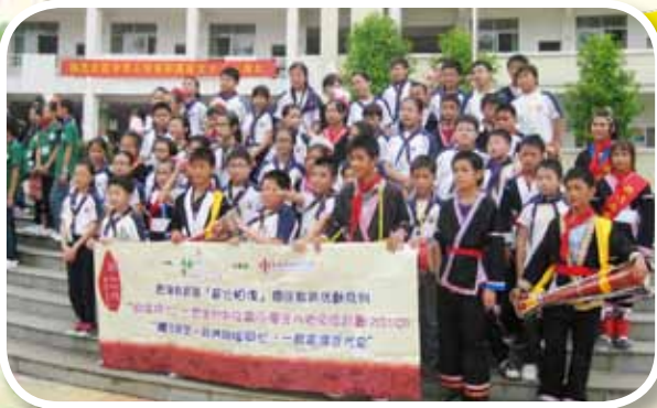
學生於民族小學門前拍大合照。

最後一天，我們到訪民族小學。在那裏跟當地學生學習刺繡和跳長鼓舞，很有瑶族特色。然後我就懷着依依不捨的心情離開連南，回到香港。我真希望能再和同學們到外地交流，體驗不同的文化。