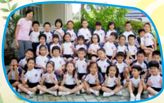
同學們與班主任在校園內拍照留念。