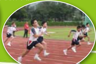
大家努力向前跑，勝利在望!