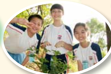
學生參與植樹活動，齊來為環保出一行力。