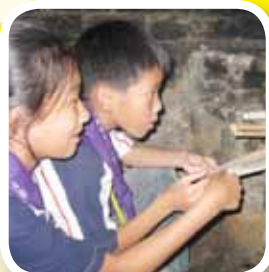
探訪農戶時，學生更嘗試以柴火煮菜。