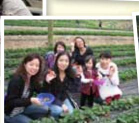
老師採摘甜甜草莓。