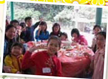
郊外環境幽美，這頓飯也特別美味！