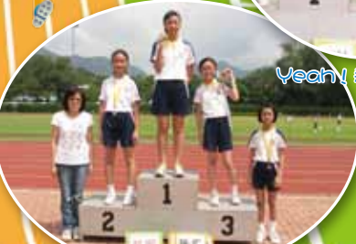
同學們在頒獎台上的風采!