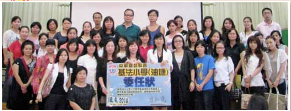
家教會全體義工合照，陣容鼎盛，盼望家長更投入參與校務，使基法(油塘)校務蒸蒸日上。