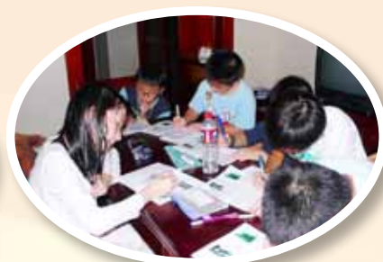
參觀完了，學生回到酒店，齊來寫報告。

整個旅程中，令我留下最深刻印象的是有機會到田裏種菜，讓我深深體會到農夫種菜的辛勞。