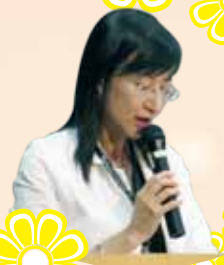
梁校長於小一家長講座上詳細解釋本校的運作及教學情況。