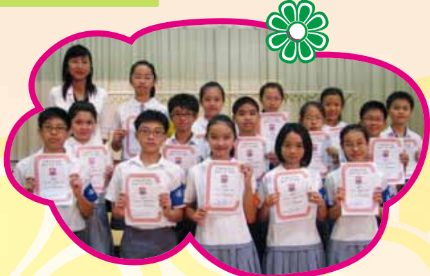
九月初，校長頒發委任狀予本年度的領袖生，藉此勉勵領袖生努力為同學服務。