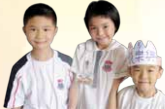
「小一特工」哥哥姐姐真友善。