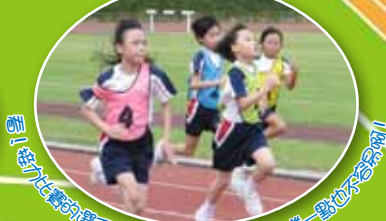
看! 我們的選手們跑得真快，彎彎出誰第一點也不容易啊!