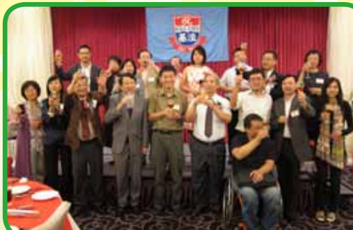
馮文正校監、校長、老師及各校友祝賀大家於新學年能學業進步、事事順利。