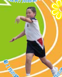
唔! 我的體力多驚人，棒木球是我的強項。