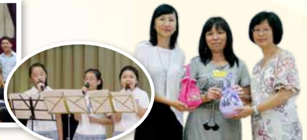
同學們為老師獻唱。家長義工為校長及副校長獻上愛心禮物包。