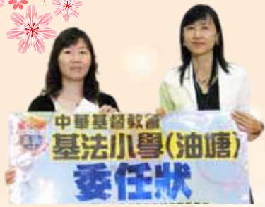
梁校長頒發家長義工委任狀給家教會主席，象徵家校合作無間。