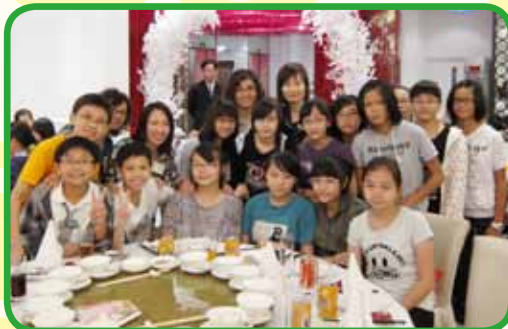
去年六年級畢業生參與校友會聚餐，與老師聚首一堂，並分享中學的校園生活。