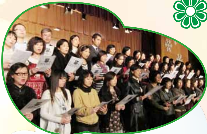
梁校長與老師們合唱聖誕歌，他們唱了一首名為“誰是主角”的歌曲，歌詞真的很有意義。