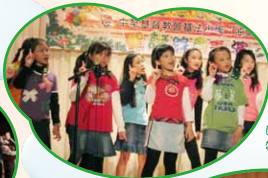
民歌組同學載歌載舞，帶動台下觀眾一同合唱。