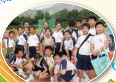
比賽完畢，大家來張大合照吧!