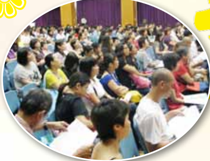
講座上每位家長都非常專心地細聽著。