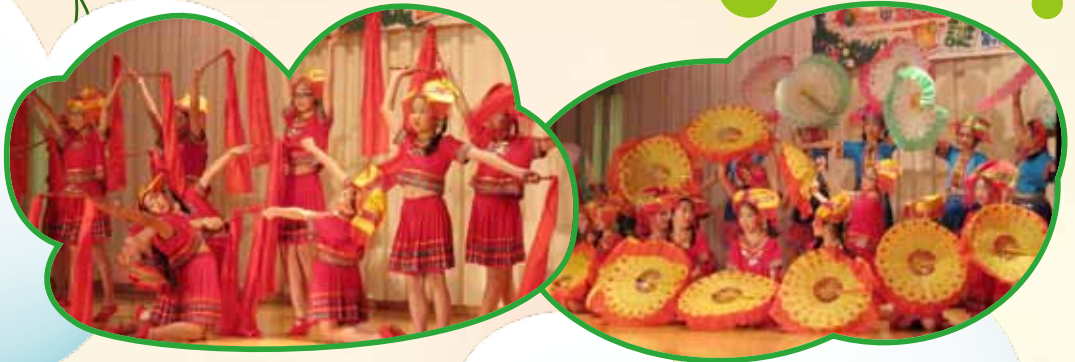
同學們穿上鮮豔的舞衣，舞姿優美，盡力演出，台下觀眾都報以熱烈掌聲。