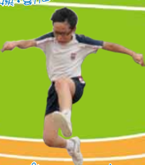
跳遠的選手果然厲害!