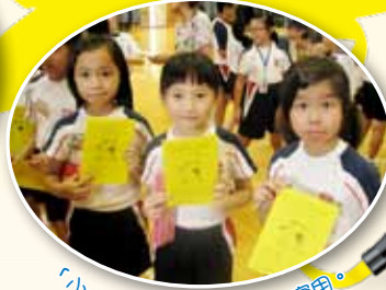
「小一特工手冊」又精美又實用。