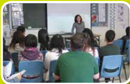
英文科邀請了校外專家到校講解有關本年度發展項目的要點。