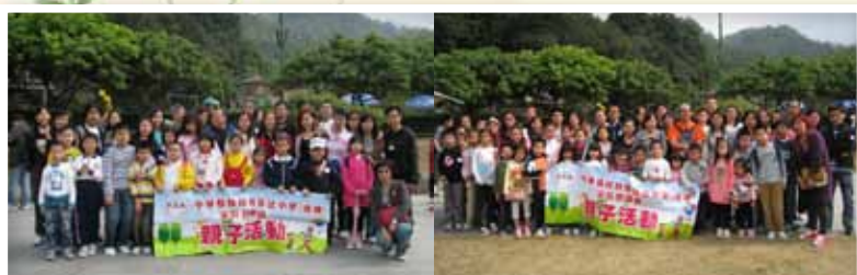
陣容鼎盛，齊行批拍照。