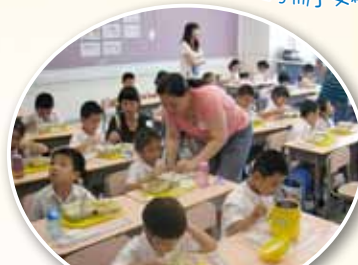
家長義工協助同學進行午膳。