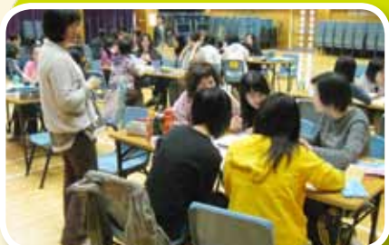
副校長和眾教師一起投入分組活動中，並以學生身份體驗合作學習的好處。