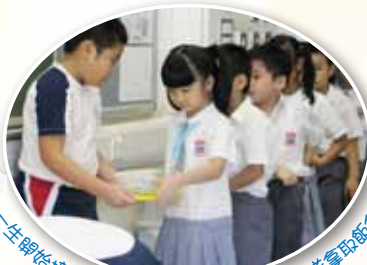
小一生開始接受午膳訓練，大家守秩序地排隊領取飯盒。