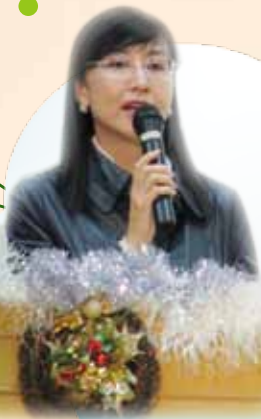
在聖誕晚會開始前，梁校長祝願同學們聖誕快樂，並把握機會勉勵同學。