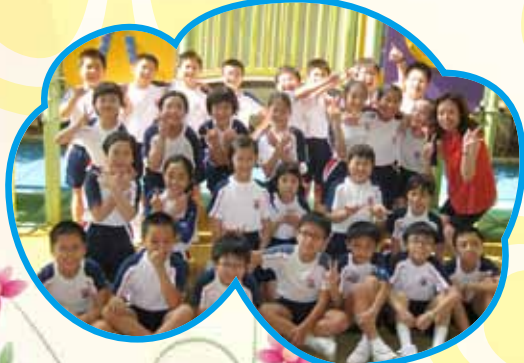
各班均參與大合照，擺出不同姿勢。