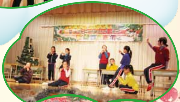
話劇組同學聯同歌詠組合力演出，家長和同學們都看得十分投入。