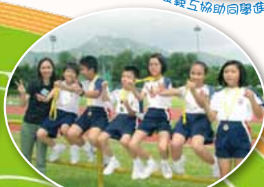
看! 我們的獎盃多漂亮!