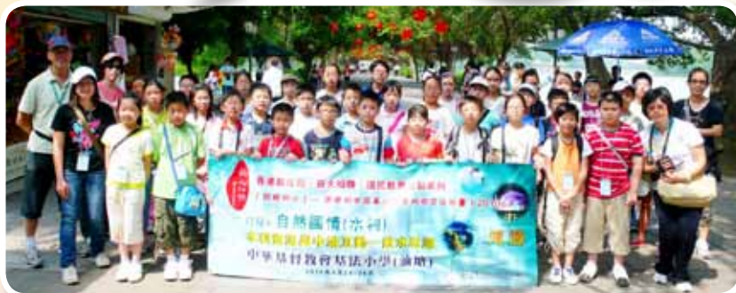
學生於惠州西湖旁合照，認識當地「引濶工程」。