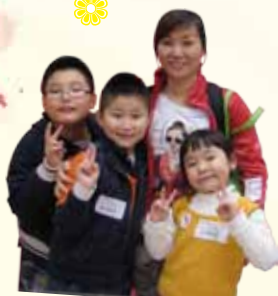
親子旅行，一家樂陶陶！