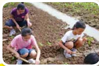
齊來種菜做個小農夫，體驗農耕生活，一瓜一菜得來不易喇！