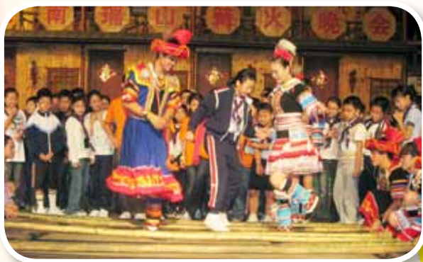
於盤古王公園篝火晚會中，學生投入地參與瑶族歌健活動。