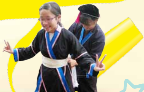
學生試穿瑶族傳統民族服裝，感覺新奇。