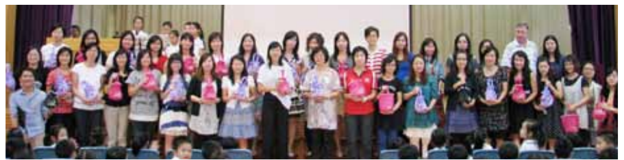
一至三年級老師們，齊齊接受愛心禮物包，臉上洋溢歡愉與感激。