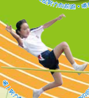
唔! 努力向上跳，跳高也難不到我們的同學。