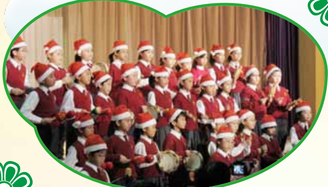
你聽！節奏樂組的同學以不同的敲擊樂器演奏一曲“點綴廳堂”，令觀眾們也聽出耳地。