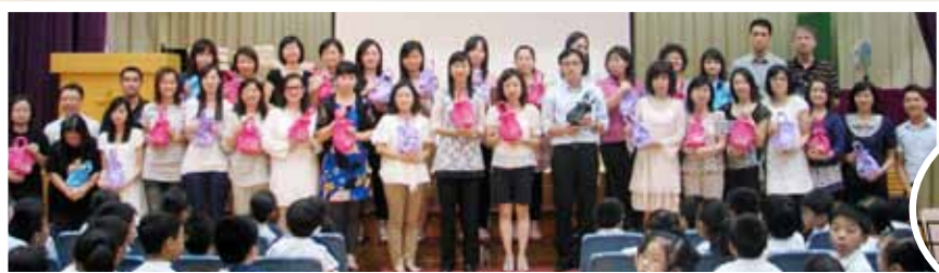
四至六年級老師們也收到愛心禮物包，同樣感到無比愉快！