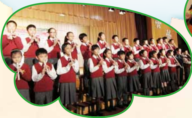
同學以木笛吹奏動聽的聖誕歌，增添聖誕歡樂的氣氛。