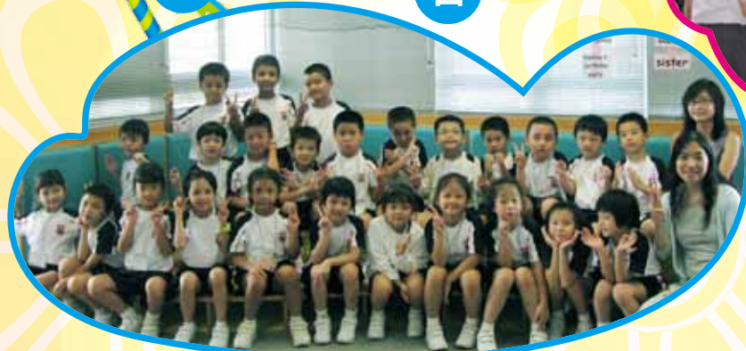
同學們與班主任、副班主任拍照，他們都展露出燦爛的笑容。