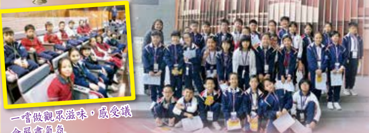
一嘗做觀眾滋味，感受議會嚴肅氣氛 我們都會尊重法例，謹守法紀，做個好市民