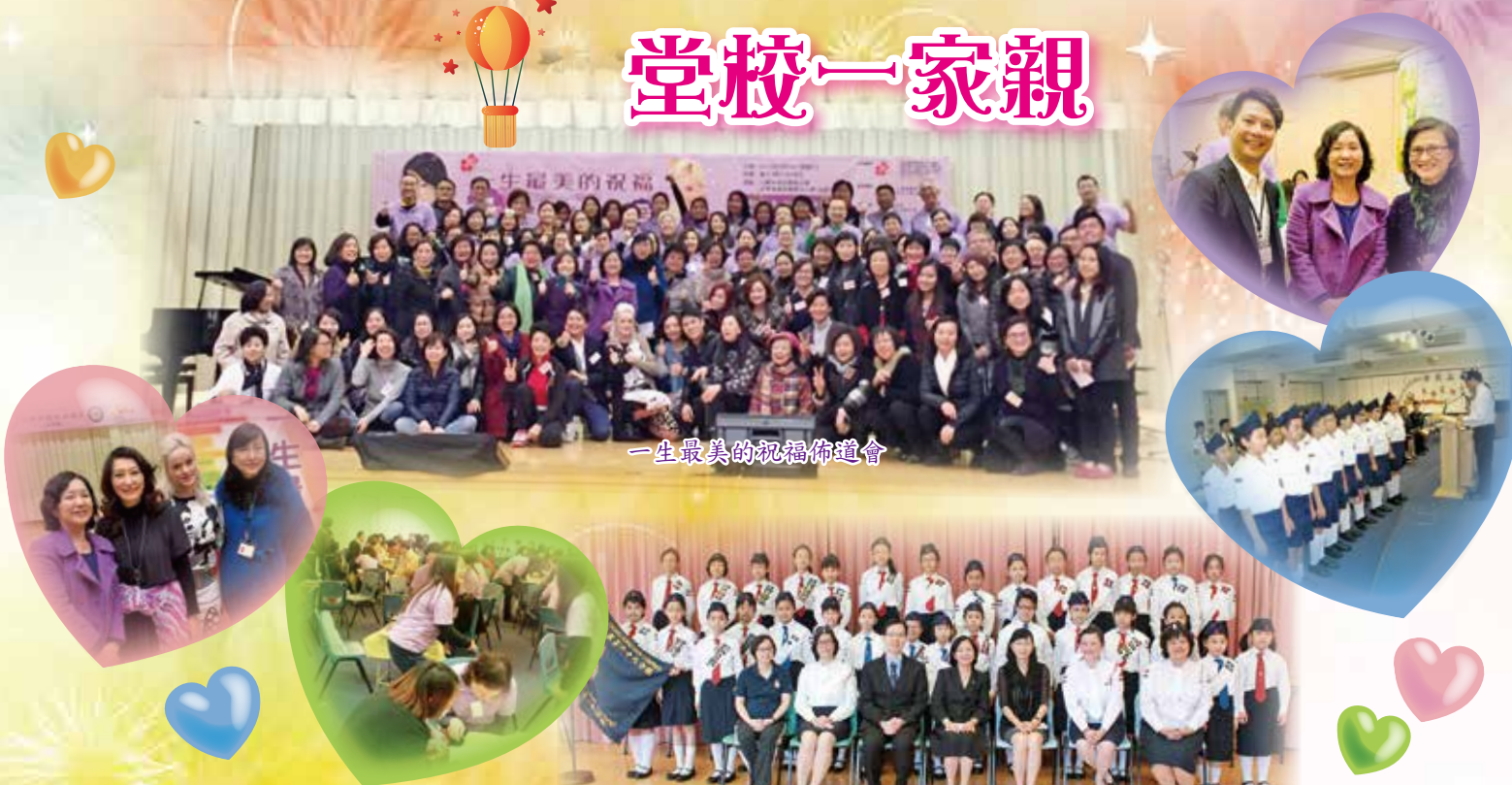
一生最美的祝福佈道會