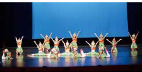
在第五十一屆學校舞蹈節中國小學低年級組獲甲級獎。