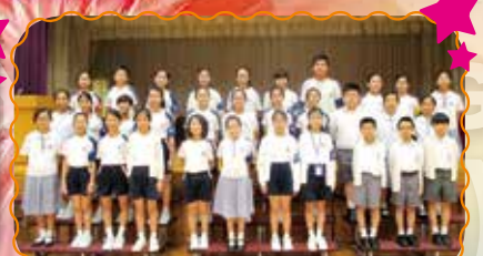
本校英文集誦隊獲得四至六年級英詩集誦季軍