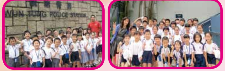
今天終於有機會走進神秘的警察局啦！