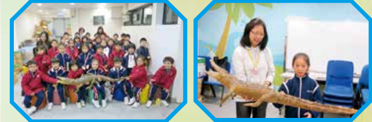
聽完講解，我們準備出發探險去！ 雖然是標本，但同學也有點心慌慌