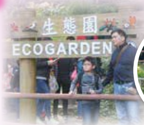
父與子、妹與弟好溫馨啊!

家教會於1月18日在綠田園甲龍圍舉行親子旅行，今年參加人數眾多，師生共聚，家校同樂，樂也融融。透過相片可分享當天的喜悅。