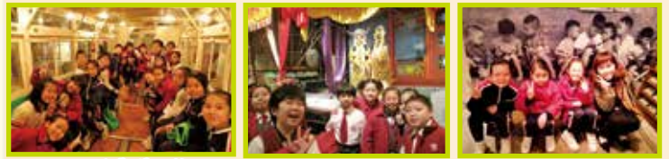
叮叮叮的集體回憶 粵劇角色的造形美輪美奐 排排坐，吃粉果