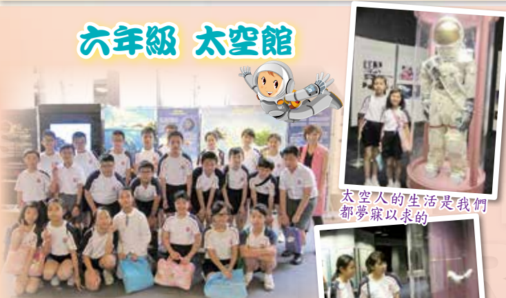
觀看天象節目，對太空的認識不會再遠無邊際了