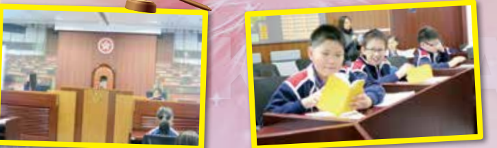
當立法會主席，腦筋要很靈活 認識法案三讀程序