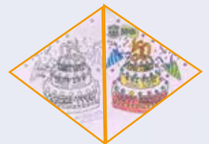
1C Leung Ho Yin