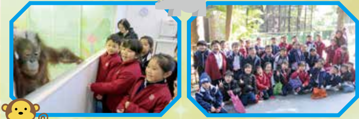
小猩猩，很可愛喎！ 天朗氣清，寓學習於遊樂