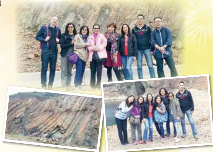
一眾教師在這國家級特殊地貌前留影。