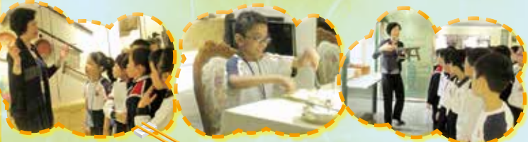
懂得用筷子也是中國人很棒的一件事！ 飲食文化也講究餐桌禮儀 大家來認識久違了的大排檔本土文化