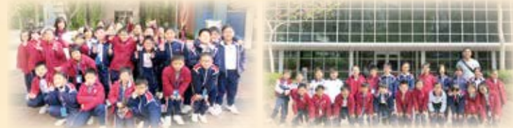
一起來參觀香港歷史博物館，一起來想當年，話當年