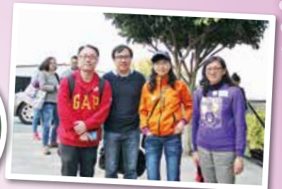
梁校長、柯副校長、關主任和老師也大力支持家教會活動。