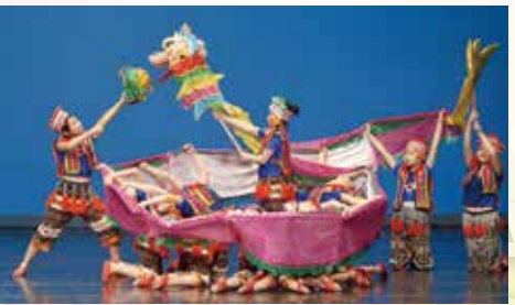
在第五十一屆學校舞蹈節中國小學高年級組獲優等獎。