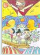
冠軍 6A 施佩希