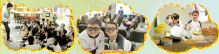
除了專心看、留心聽，如果可以試食就好啦！ 用3D眼鏡看食物影片特別立體，肚子也特別餓 一底香噴噴的雞蛋仔是怎樣製成的呢？