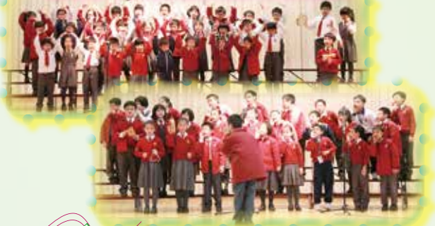
在班際歌唱比賽時，悅耳的音樂和動聽的歌聲在禮堂裏迴響！