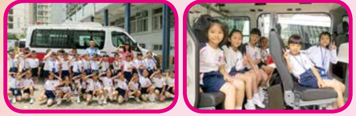
小時候的志願，很多同學不分男女，都會想過當個警察吧！ Yes Sir！我們會做個小乖乖的