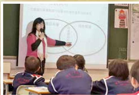
陶老師利用溫氏圖引導同學對事件作出比較。