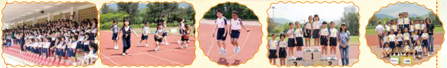
每場都是激烈的比賽，學生們都盡全力去爭取好成績。