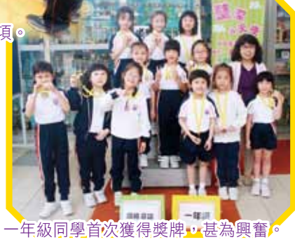
一年級同學首次獲得獎牌，甚為興奮。