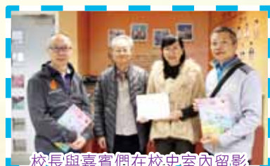
校長與嘉賓們在校史室內留影