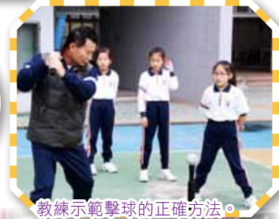
教練示範擊球的正確方法。