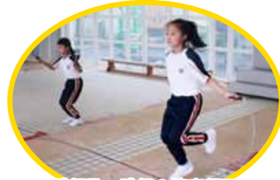
同學身體輕盈，跳繩？簡直輕而易舉！