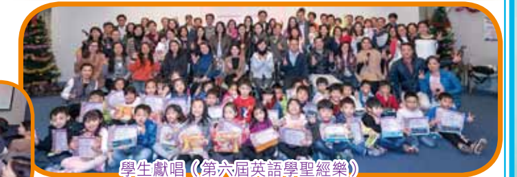
學生獻唱 (第六屆英語學聖經樂)