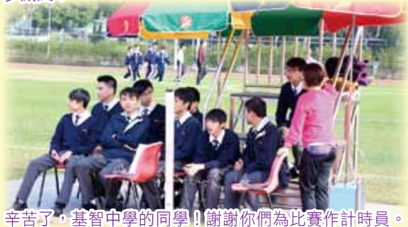
辛苦了，基督中學的同學！謝謝你們為比賽作計時員。