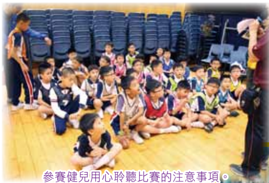
參賽健兒用心聆聽比賽的注意事項。