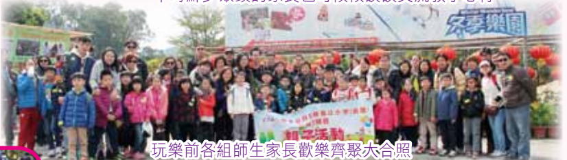
玩樂前各組師生家長歡樂齊聚大合照