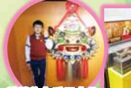
麒麟製作手工非凡。