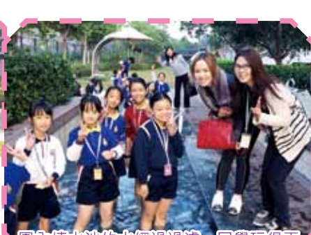
園內嬉水池的水經過過濾，同學玩得更加安心。