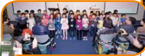
主日兒童下午活動