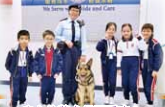
忠心的警犬很可愛嘍!