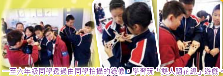
一至六年級同學透過由同學拍攝的錄像，學習玩「雙人翻花繩」遊戲。