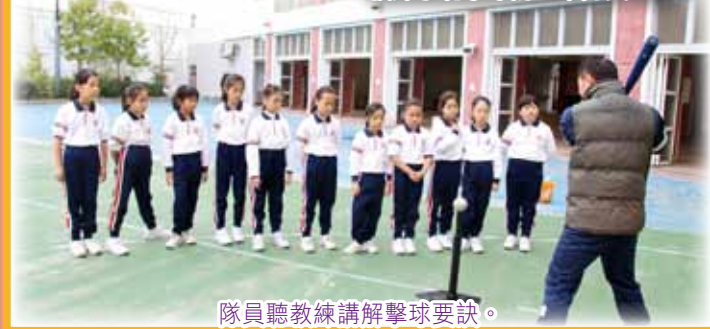
隊員聽教練講解擊球要訣。