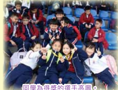
同學為得獎的選手高興。