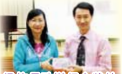
梁校長致送紀念狀給黃金耀博士。

學校在四月三日舉行了下學期教師專業發展日，上午時段配合學校本年度關注事項——STEM（科學、科技、工程、數學）教育，邀請了「香港新一代文化協會」總監黃金耀博士蒞臨主持工作坊。STEM教育是教育局近年重點發展項目，教導學生結合四科內容，發揮創意潛能，以裝備他們應對社會及全球因急速的經濟、科學及科技發展所帶來的轉變和挑戰。黃博士在推動創新科技教育已有多年經驗，是次工作坊除了向教師解釋STEM教育的理論基礎外，還讓教師們嘗試動手做一些科學實驗，學習如何從實作中進行科學探究，教師們均獲益良多。