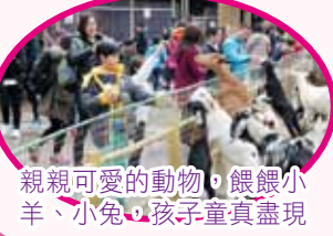
親親可愛的動物，餵銀小羊、小兔，孩子童真盡現