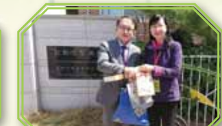
校長與當地校長交換紀念品