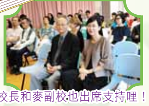
校長和麥副校也出席支持哩！