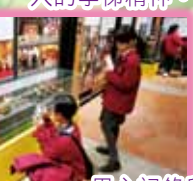
用心記錄所見所聞