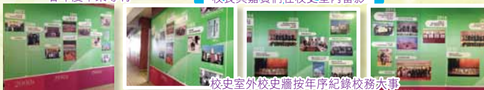
校史室外校史牆按年序紀錄校務大事