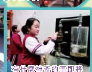
有什麼神奇的事即將發生呢?