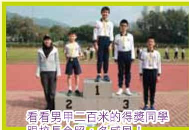
看看男甲二百米的得獎同學 跟校長合照，多威風！