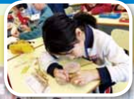
一至三年級「繪畫小搖鼓活動」