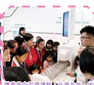
導賞員向同學講解「化廢為能」的程序。