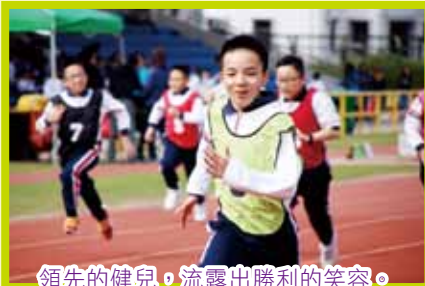
領先的健兒，流露出勝利的笑容。