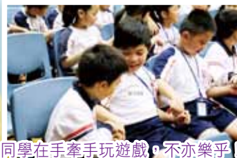
同學在手牽手玩遊戲，不亦樂乎！