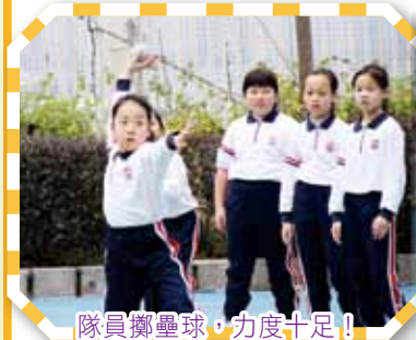
隊員擲壘球，力度十足！