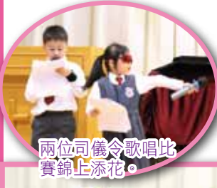
兩位司儀令歌唱比賽錦上添花。