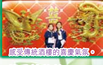
感受傳統酒樓的喜慶氣氛。