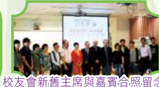
校友會新舊主席與嘉賓合照留念