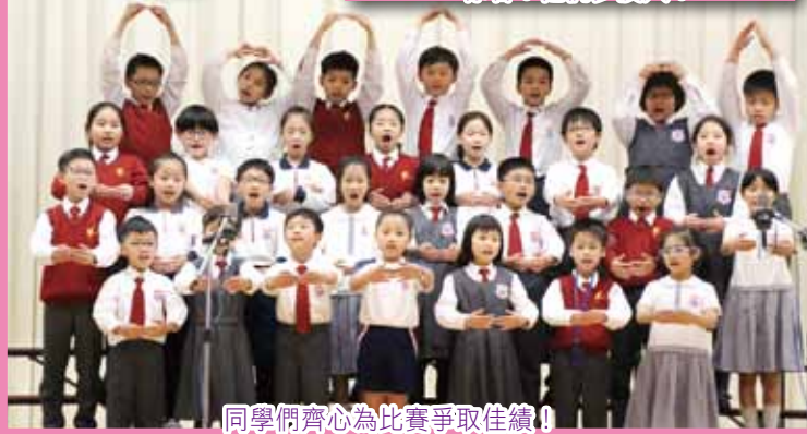
同學們齊心為比賽爭取佳績！