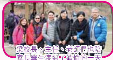
梁校長、主任、老師們也陪家長學生渡過了歡愉的一天