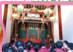
從建築風格看中國人的孝悌精神。