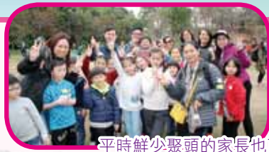
平時鮮少聚頭的家長也可傾傾談談交流教子心得

一年一度的親子大旅行於2月26日在大棠有機生態園舉行，師生家長可以一起郊遊，放鬆心情，親近大自然，可謂家校共融，樂也融融。