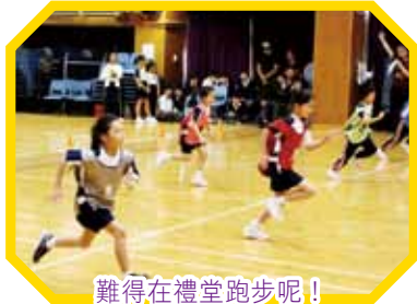
難得在禮堂跑步呢！