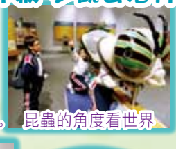
昆蟲的角度看世界