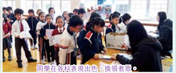
同學在各科表現出色，換領者眾。