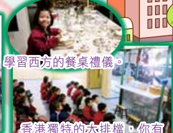
學習西方的餐桌禮儀。