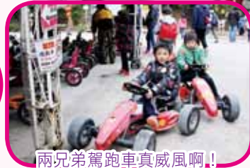
兩兄弟駕跑車真威風啊!!