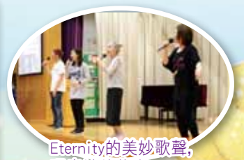
Eternity的美妙歌聲，唱出神的信息。