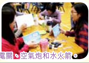
黃博士帶領教師進行多項科學探究實驗，包括：冒險過電關、空氣炮和水火箭。