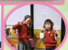
細心聆聽非物質文化遺產的承傳價值。