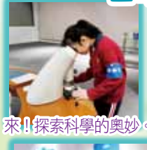
來!! 探索科學的奧妙。