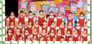
1617聯校畢業典禮歌詠表演