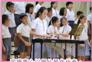
同學專心以鋼琴作伴奏，令演出更精彩。