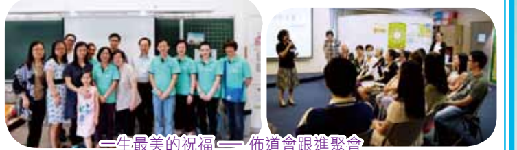
一生最美的祝福 — 佈道會跟進聚會