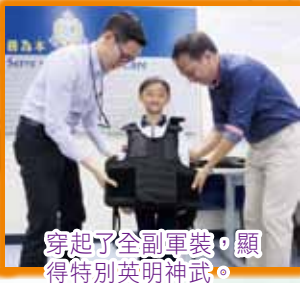
穿起了全副軍裝，顯得特別英明神武。