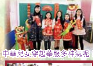
中華兒女穿起華服多神氣呢！