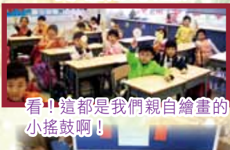
看！這都是我們親自繪畫的小搖鼓啊！