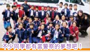
不少同學都有當警察的夢想吧!