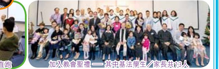
加入教會聖禮 — 其中基法學生/家長共13人