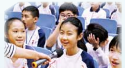
同學聽故事樂在其中，爭相回答問題。

本校於4月11日舉行復活節崇拜，當天邀請了「Eternity永恆音樂事工」分別為高低年級帶領復活節音樂佈道會。當中包括唱詩歌、玩遊戲、故事和見證分享。最後透過話劇和呼召，希望讓更多同學能決志相信主。