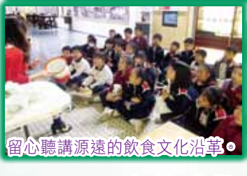
留心聽講源遠的飲食文化沿革。