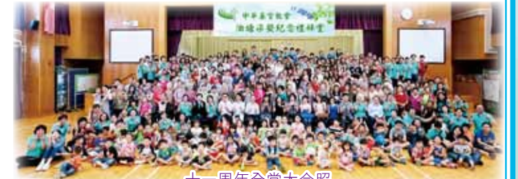
十一周年全堂大合照