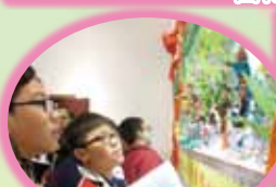
電子化戲劇富現代感。