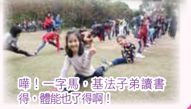
嘩！一字馬，基法子弟讀書得，體能也了得啊！