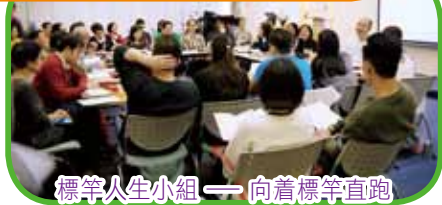
標竿人生小組 — 向着標竿直跑