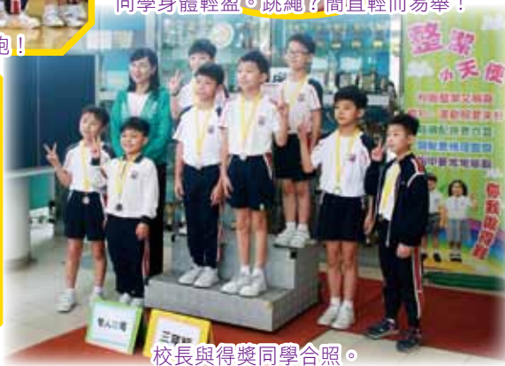
校長與得獎同學合照。