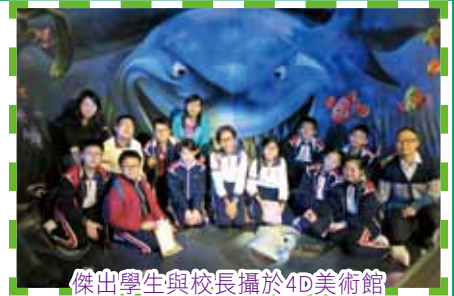
傑出學生與校長攝於4D美術館

培養學生正確人生觀之餘，家長的配合亦非常重要。父母對孩童的成績寄望愈高，孩童的壓力愈大。有些父母喜歡把兒子的成績與班內的女學生相比，其實這樣非常不公平，因為女生的語文能力向來較男生佳，相反，男生在數理方面則較女生優勝，因此父母不應著重將子女與其他人競爭或比較，反而只要幫助子女發掘潛能，並欣賞他們於該方面有所進步便已非常足夠。家長時常擔心子女輸在起跑線上，我反而認為小朋友能否愉快學習、培養學習興趣更為重要，因為孩子學習開心，長大後都會喜歡學習；如果從小強迫孩子學習，長大後不受家長管教下就不再學習，那便沒意思。此外為顧及男生的學習發展，本校在常識科、數學科、資訊科技科的課程實踐STEM教育計劃，並透過科技日、實驗課、智能機械車課程，滿足學生探究、創新的能力，同時配合現代教育新趨勢。近年來科技資訊發達，學校在各科推行電子學習，以加強學生網上學習能力，也參加了「學生支援健康網絡計劃」，學生在利用電子網絡學習的同時，學校會引導他們如何正確地使用電子網絡系統，並培養學生資訊素養。學校本年度的關注事項是「行政及教學電子化」，「實踐健康校園」及「擴闊學生學習經歷」，盼望學生經過六年的小學階段，能喜愛學習，充滿學習動機，將來運用所學貢獻社會，成為社會上的既健康又滿有才華的小天使。