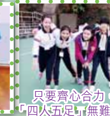
只要齊心合力，「四人五足」無難度！