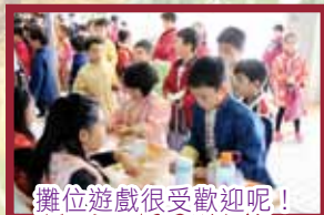
攤位遊戲很受歡迎呢！