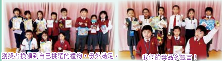
獲獎者換領到自己挑選的禮物，份外滿足。