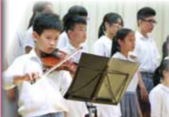
同學以小提琴作伴奏，很是陶醉。