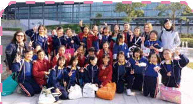
同學來到 T-PARK，當然要來一張大合照啦！