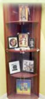
境外交流時各單位送贈的紀念品