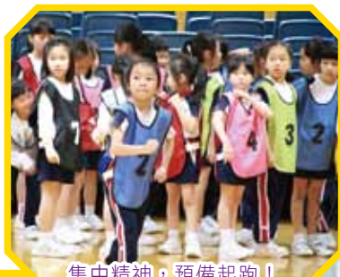
集中精神，預備起跑！