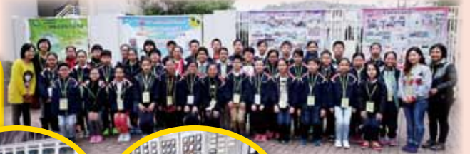
大家於河源市的小學參加升旗儀式，非常莊重！