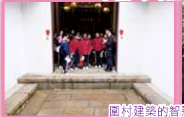
圍村建築的智慧真了不起!