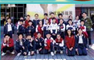
一起勇闖科學領域。