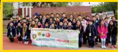
同學們跟當地同學進行各式各樣的交流活動。