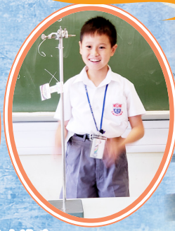
怎樣可以將降落的原理改良得更好呢？