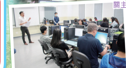
教師分享電子學習的教學經驗和心得，並進行專業交流。