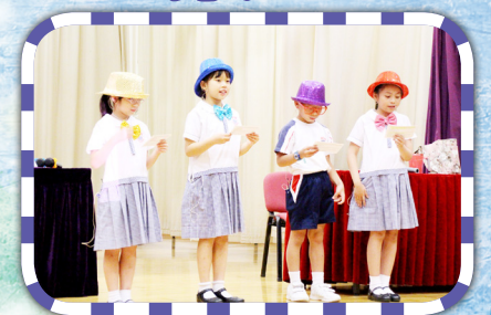
小司儀戴上彩色帽子，精靈醒目！