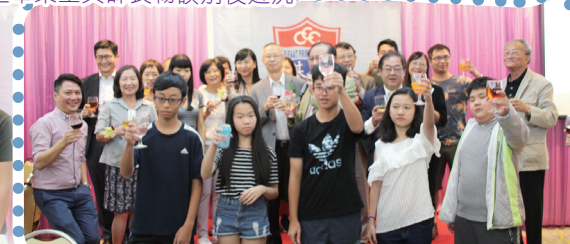
一群畢業生說了別後心聲後與麥副校、鄭主任一起舉杯祝酒。