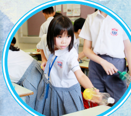
透過實驗感受空氣的存在