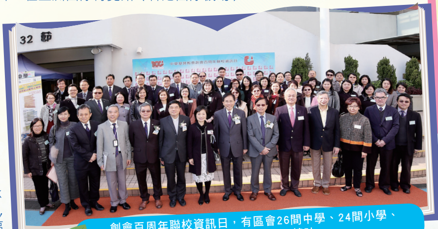
創會百周年聯校資訊日，有區會26間中學、24間小學、6間幼稚園共同參展，體現區會合一精神。

希望透過上述活動，大家對中華基督教會的先賢遠象及創會精神有更深的認識，以致再次凝聚及結連起來，擁抱同一遠象，承傳百年使命，同心合意實踐區會之合一精神，一同參與，共同分享，互動服事去傳基督福音，把上主的愛帶進社群。