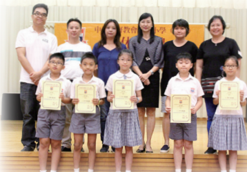
四至五年級家長與學生在嘉許禮合照