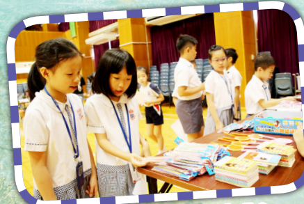
「我較喜歡這份禮物，你呢？」