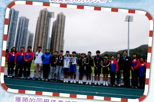
獲勝的同學捧着獎盃，與嘉賓合照。