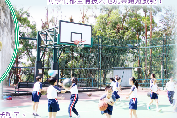
活力充沛的同學都急不及待去參加戶外活動了。