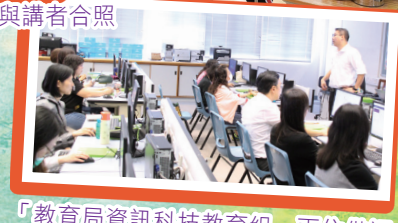
「教育局資訊科技教育組」兩位借調教師到校分享電子學習的發展經驗，並帶領教師試用相關的教學軟件。