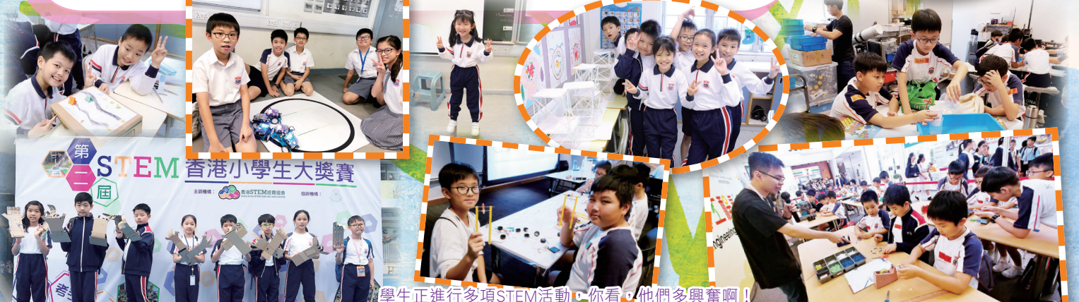
學生正進行多項STEM活動，你看，他們多興奮啊！