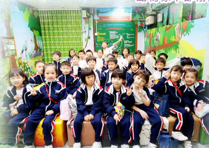
跨出課室，走進自然