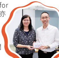
柯副校長致送紀念品給主講嘉賓