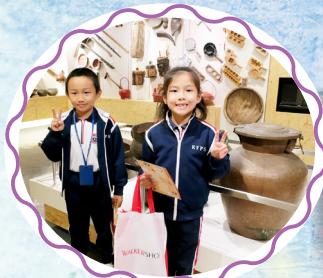
古時的盛器比我們的個子還要大