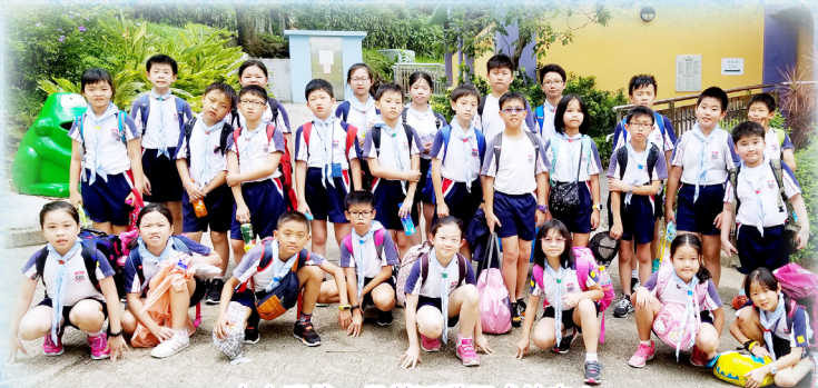
大合照後，日營活動正式結束！