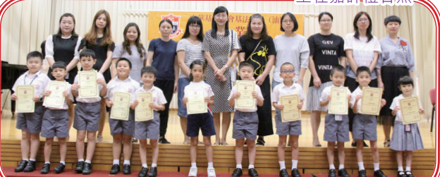
一至三年級家長連同學生在嘉許禮中合照