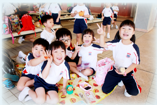
在學校操場野餐別有一番風味呢！

在去年11月初秋風送爽的日子，是我校一年一度的旅行日，三、四年級同學去了鯉魚門公園及度假村，五、六年級同學去了曹公潭戶外康樂中心。