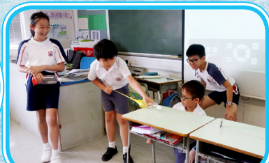
來試試空氣的力量