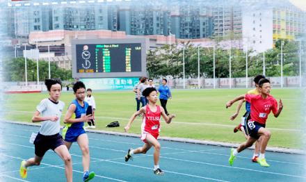
比賽健兒努力爭勝！