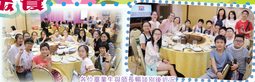
各位畢業生與師長暢談別後近況

一年一度的校友會聚餐於去年十月舉行了，不少校友聚首一堂，彼此分享近況，場面十分熱鬧。