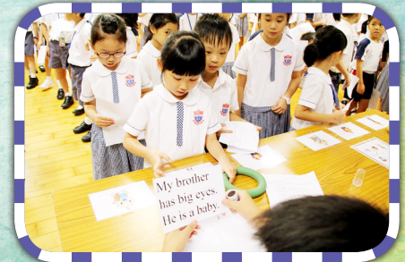
「猜猜誰是我的弟弟？」