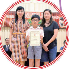
六年級家長連學生在嘉許禮合照