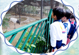
在香港也可觀賞得到很多珍貴的動物