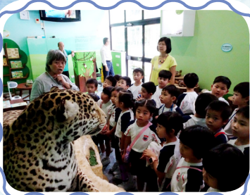
動物標本都栩栩如生