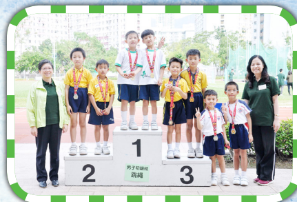
我校在跳繩男子初級組獲殿軍