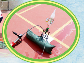
同學們設計的水火箭