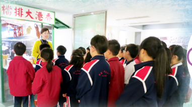
懷念那街角的味道