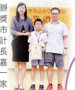
四至五年級家長連學生在嘉許禮中合照（續）

為表揚家長積極參與學校舉辦的家長教育活動，本校設立學分獎賞，累積滿指定學分可獲超級市場禮券。本學年更增設家長教育計劃嘉許禮，獲得最高分數的家長（低、高年級各十名）可以領取嘉許狀，子女陪同家長上台領獎，一同分享這份殊榮，以鼓勵及肯定家長為培育子女所付出的努力。