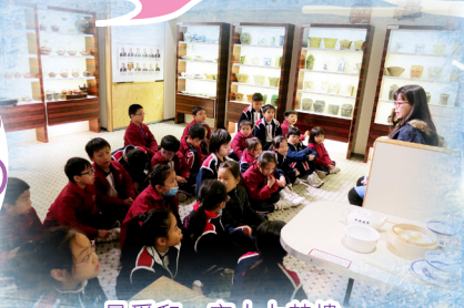
最愛和一家人上茶樓