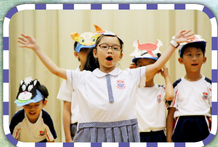
同學投入於話劇表演中。