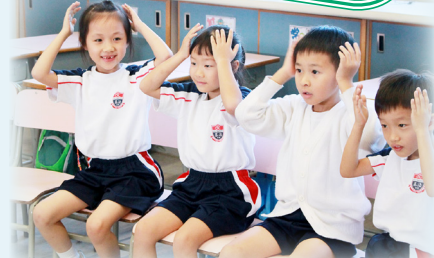
同學們都全情投入地玩集題遊戲呢！