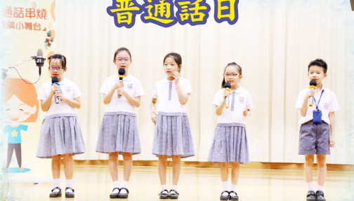
別看他們小小年紀，當起司儀來也甚具大將之風。