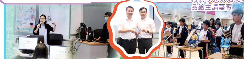
關主任與講者合照