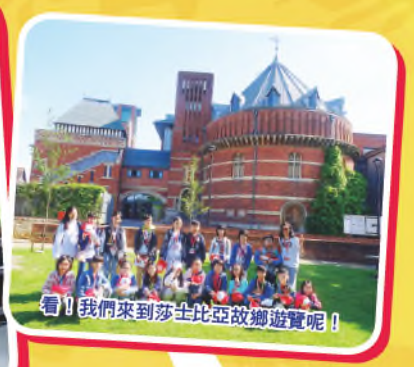
看！我們來到莎士比亞故鄉遊覽呢！