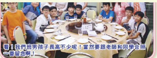
看！我們班男孩子長高不少呢！當然要跟老師和同學合照一番留念啊！