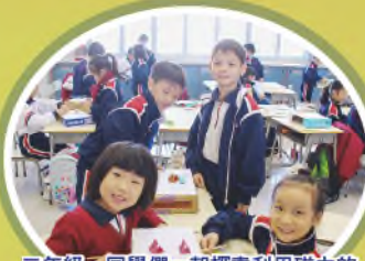
三年級 同學們一起探索利用磁力的科學原理製作新奇玩意。