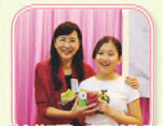
校友抽到獎，喜出望外呢！

一年一度的校友會聚餐於十月十八日（星期五）假富金軒舉行，聚餐活動每年皆召聚眾多畢業生、校友與師長暢聚一番，談談近況，場面溫馨熱鬧，期待下一年的校友會聚餐呢！