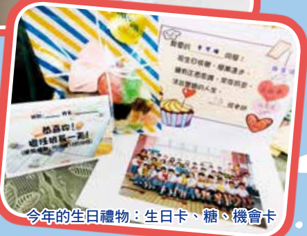
今年的生日禮物：生日卡、糖、機會卡