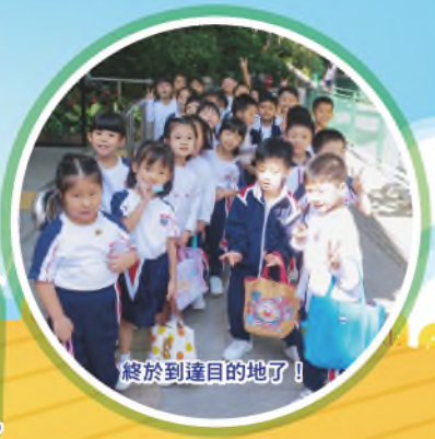
終於到達目的地了！