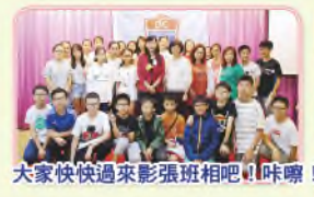
大家快快過來影張班相吧！咔嚓！