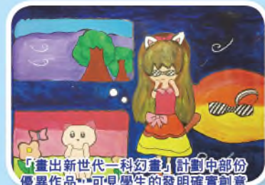
「畫出新世代一科幻畫」計劃中部份優異作品，可見學生的發明確實創意無限。