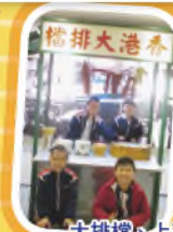
大排檔、上茶樓都是香港的傳統飲食文化呢！