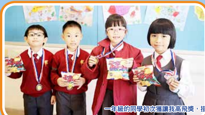
一年級的同學初次獲讓我高飛獎，掛著獎牌，拿著美食，興奮無比！

為鼓勵同學在品德和學業上不斷求進，本年度「讓我高飛獎勵計劃」以獎牌作禮品。同學們，努力呀！希望你們能集齊鑽石、金、銀和銅四個獎牌！