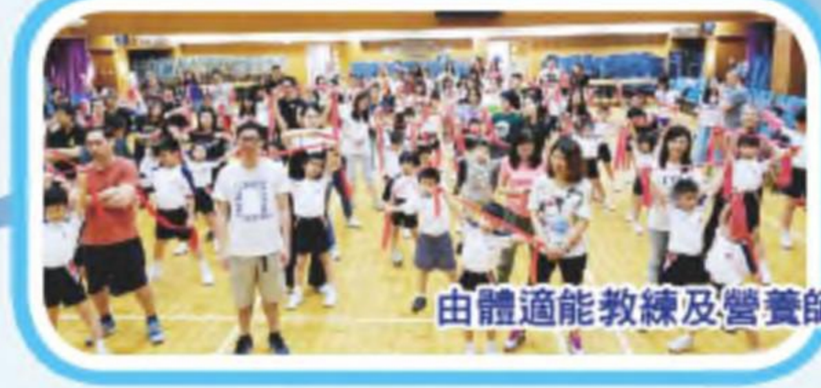
由體適能教練及營養師透過橡膠操、競技遊戲及製作小食，推動親子在家多做運動及注重健康的生活。