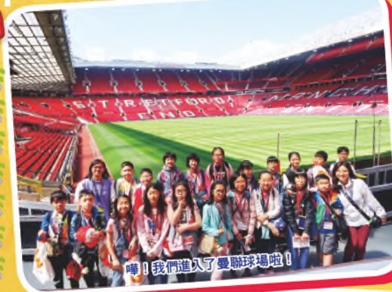
嘩！我們進入了曼聯球場啦！

在去年6月尾，五、六年級同學參加了「英國牛津英語學習團」，行程中同學們參觀了著名的景點，了解英國人的生活文化，最重要是與當地的小學生一起上課，利用英語溝通，日子雖短，但同學們卻獲益良多。