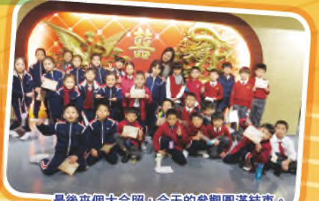
最後來個大合照，今天的參觀圓滿結束。