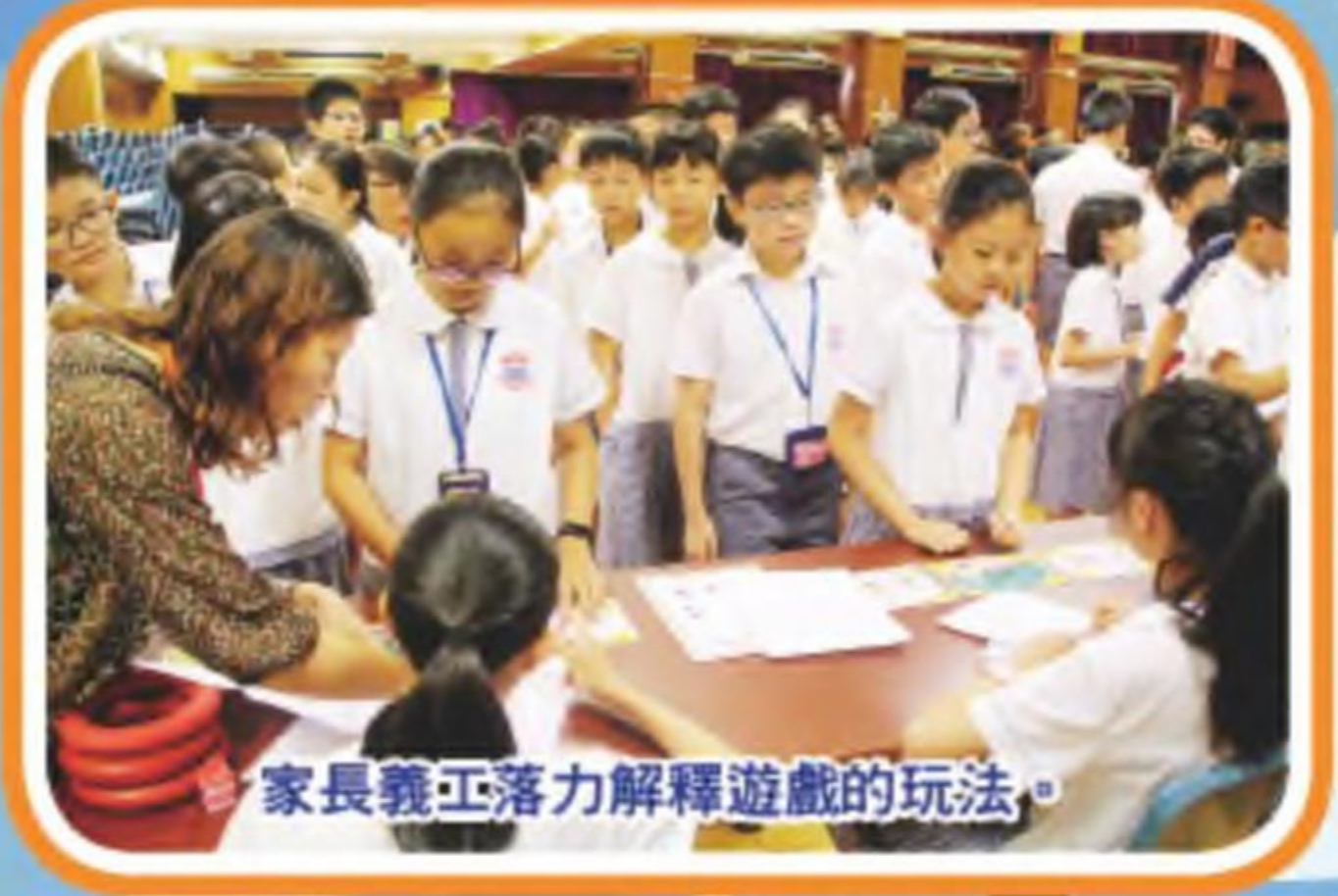
家長義工落力解釋遊戲的玩法。