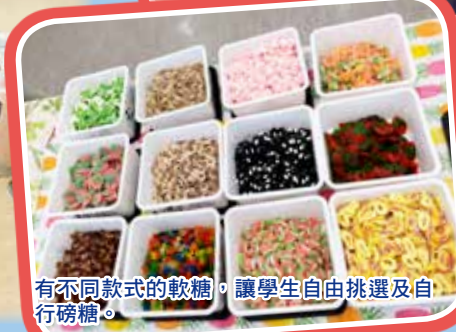
有不同款式的軟糖，讓學生自由挑選及自行磅糖。