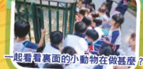
一起看看裏面的小動物在做甚麼？