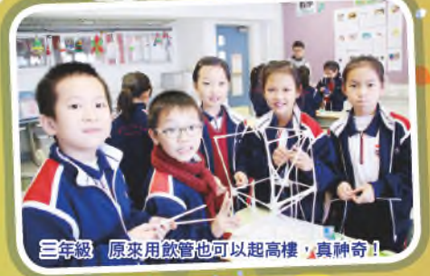
三年級 原來用飲管也可以起高樓，真神奇！