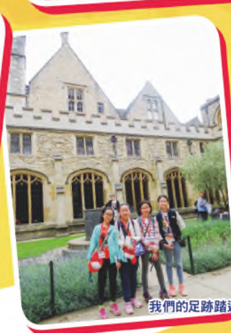
我們的足跡踏遍牛津的大街小巷。