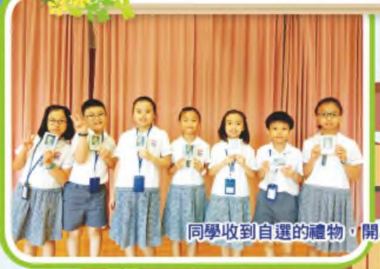
同學收到自選的禮物，開心不已，個個笑逐顏開!