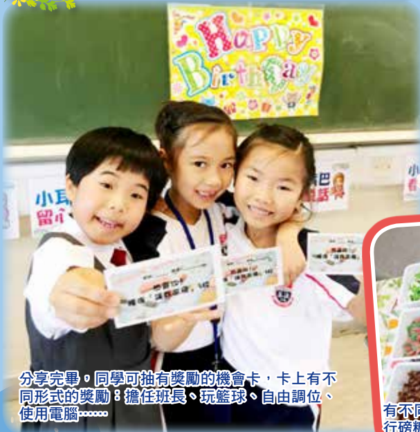
分享完畢，同學可抽有獎勵的機會卡，卡上有不同形式的獎勵：擔任班長、玩籃球、自由調位、使用電腦……