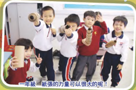
一年級 紙張的力量可以很大的呢！