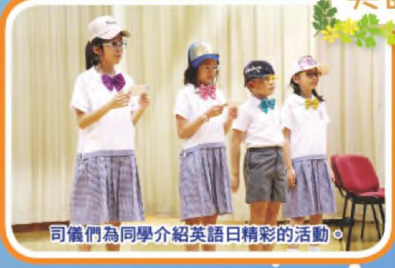
司儀們為同學介紹英語日精彩的活動。