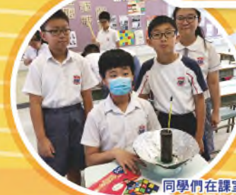
同學們在課室製作太陽能壚，再到戶外測試，看看太陽能壚能收集到多少熱能。