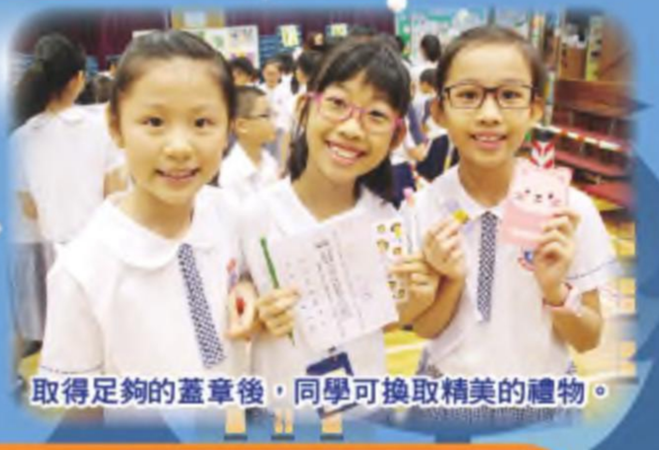
取得足夠的蓋章後，同學可換取精美的禮物。