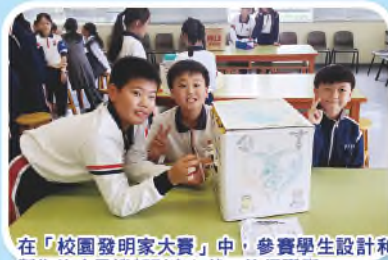
在「校園發明家大賽」中，參賽學生設計和製作的冷風機都別出心裁，值得讚賞。