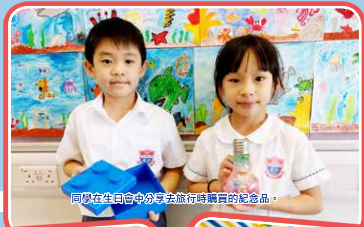
同學在生日會中分享去旅行時購買的紀念品。