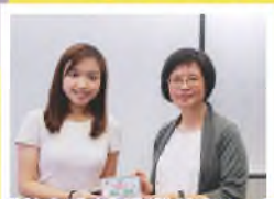
「教育局資訊科技教育組」派出兩位借調教師到校分享電子學習平台的應用技巧，並讓教師即時設計相關的教學內容。