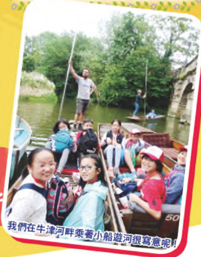
我們在牛津河畔乘著小船遊河很寫意呢！