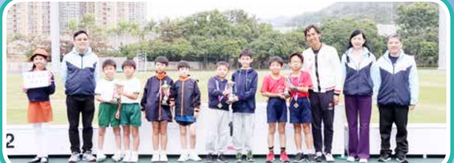
本校奪得男子丙組團體優異獎。