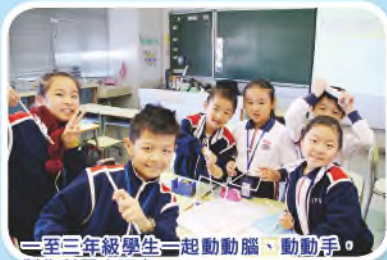
一至三年級學生一起動動腦、動動手，製作科學小玩意。