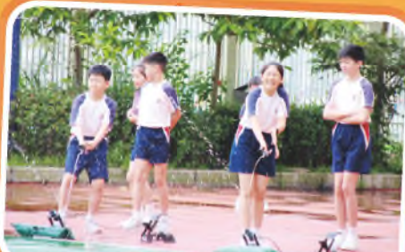
同學們用塑膠水樽設計了不同的水火箭，準備一飛衝天，看誰飛得最高、最遠？