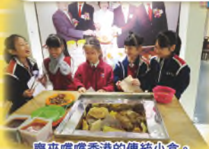
齊來嚐嚐香港的傳統小食。