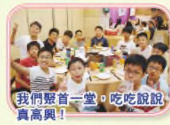
我們聚首一堂，吃吃說說真高興！